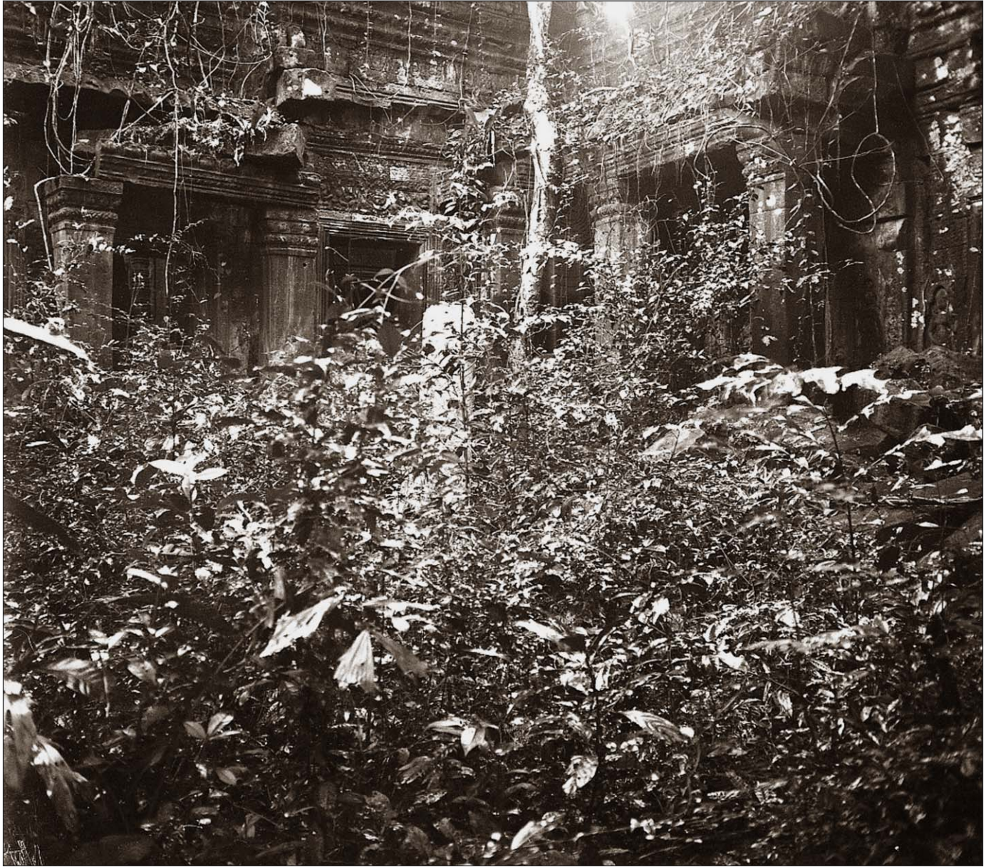
Ruines de Preah Khan.