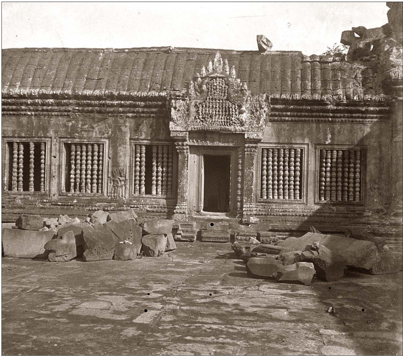
Angkor Vat - Cour galerie.