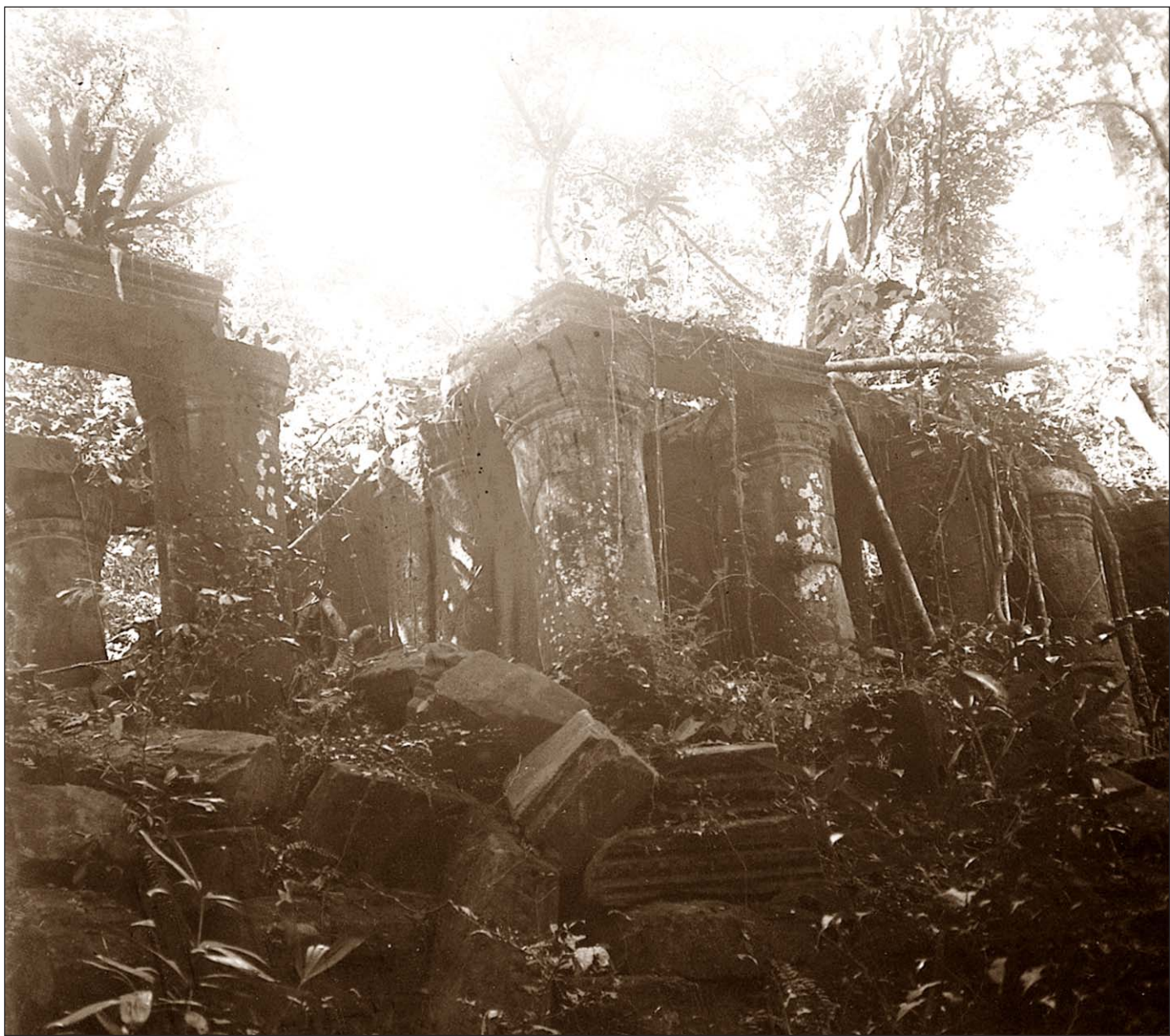
Angkor Thom - Colonnees rondes.