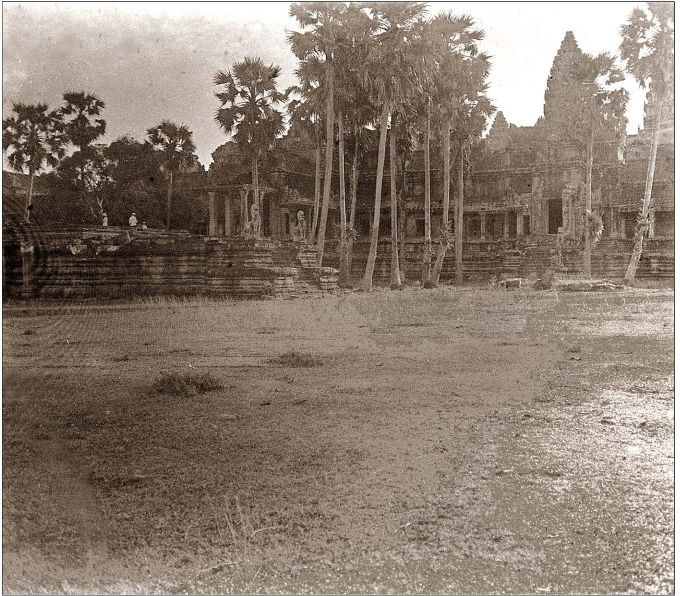
Angkor Vat - Abords du temple.