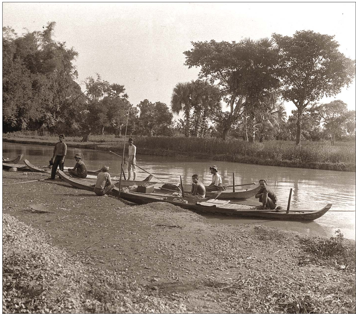
Pirogues à la briqueterie.