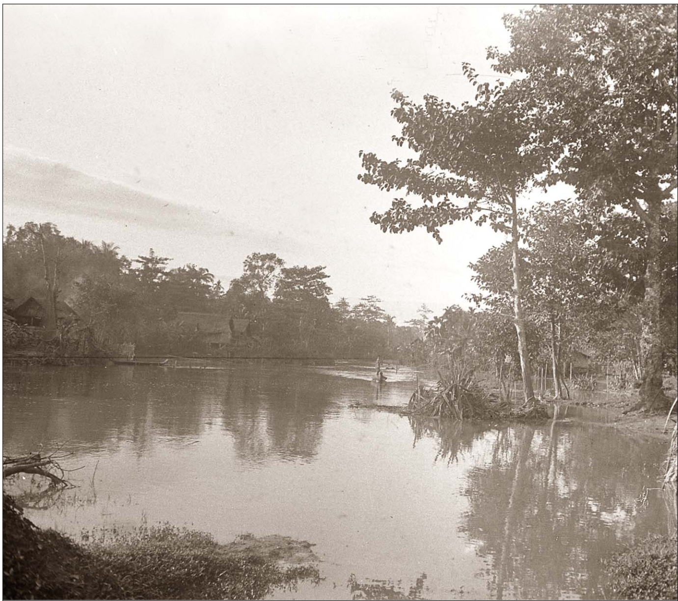
Siem Reap - Bœufs traversant la rivière.