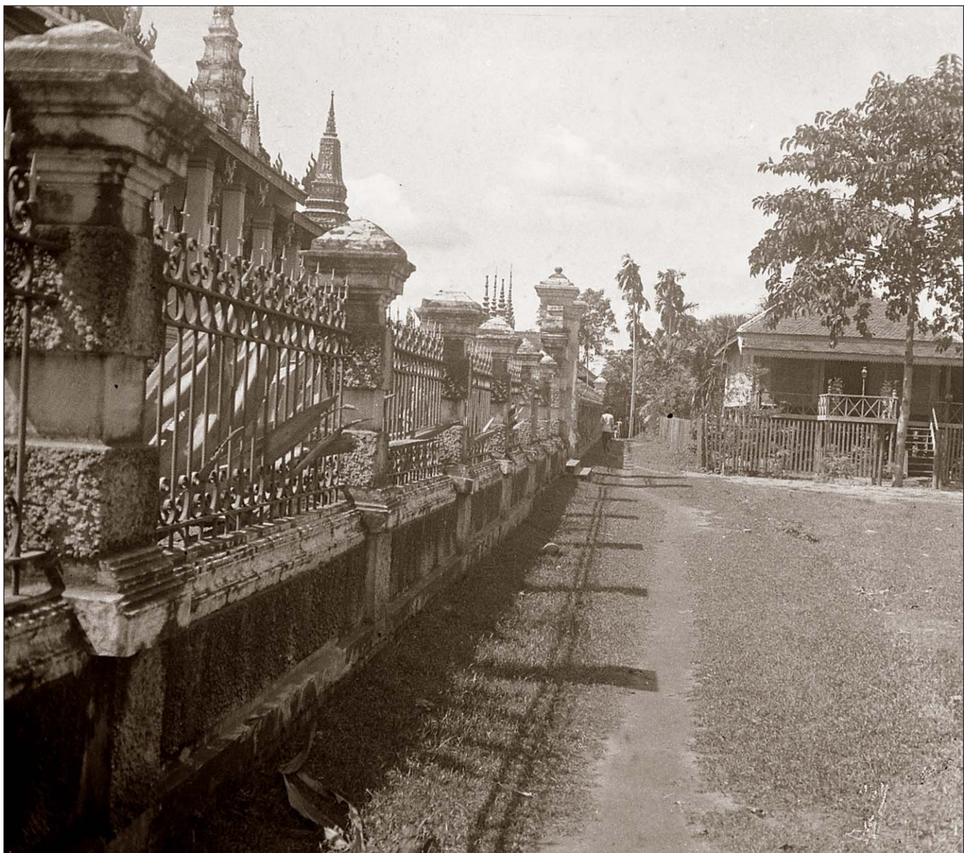
Phnom Penh - Les grilles du Palais royal.