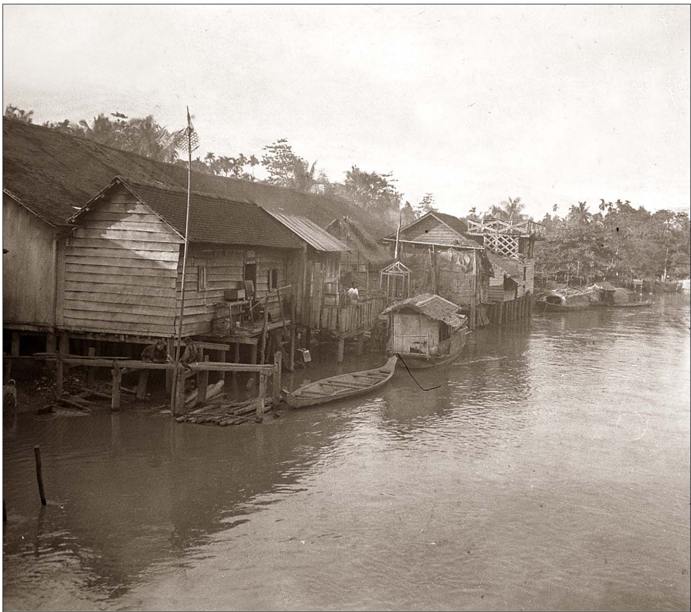
Le long de la rivière de Siem Reap.