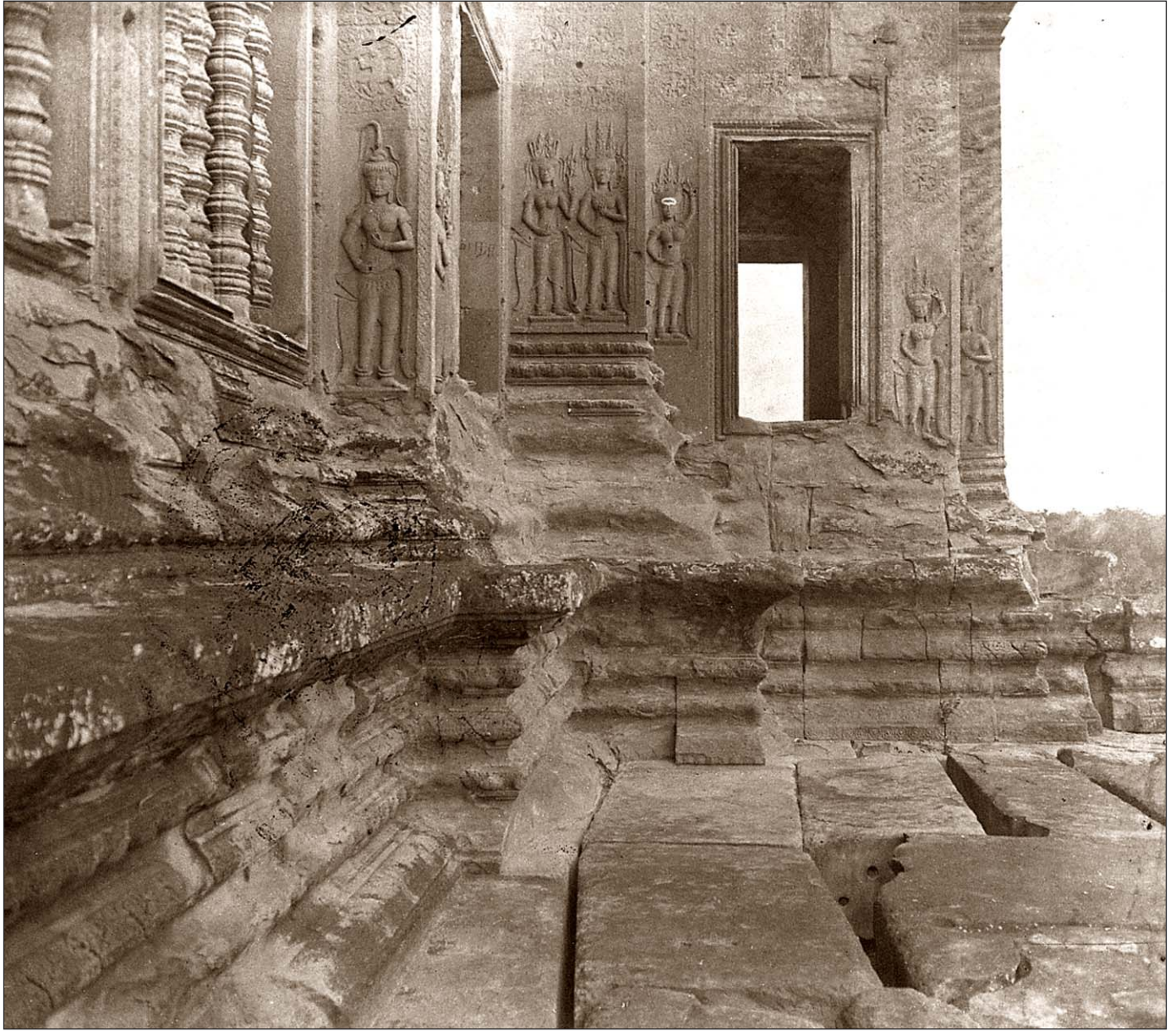
Angkor Vat - Galerie du troisième étage.