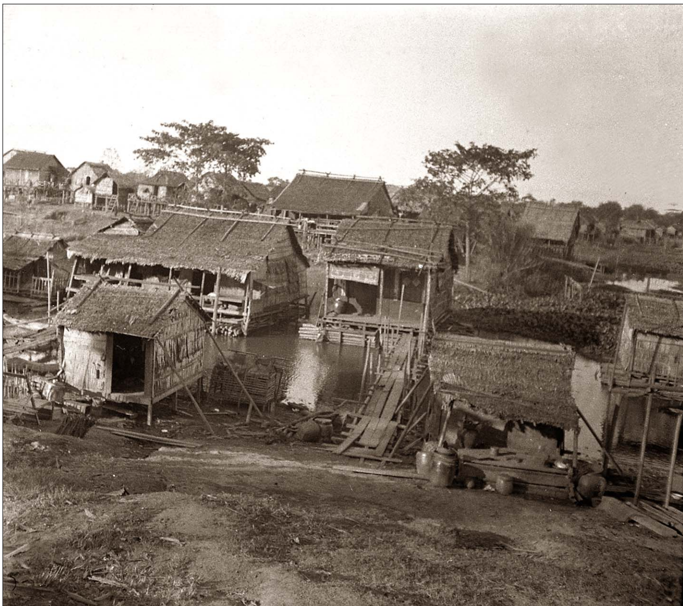
Village lacustre de Phnom Penh.