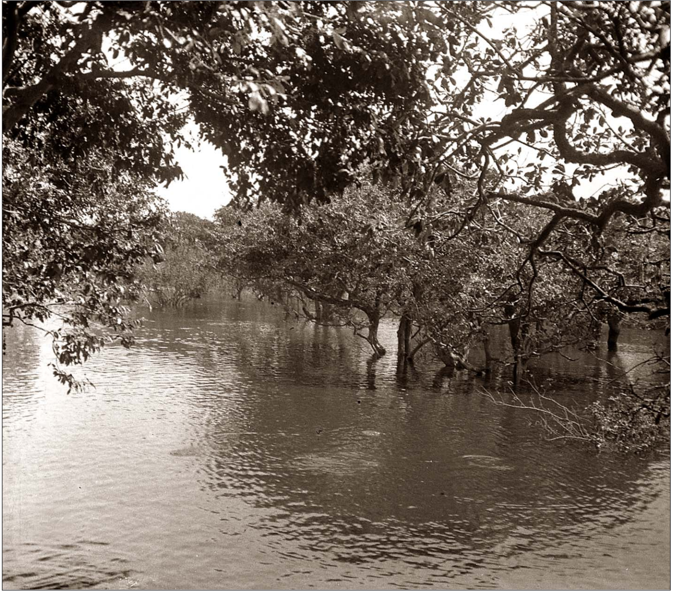
Aspect de la rive inondée.