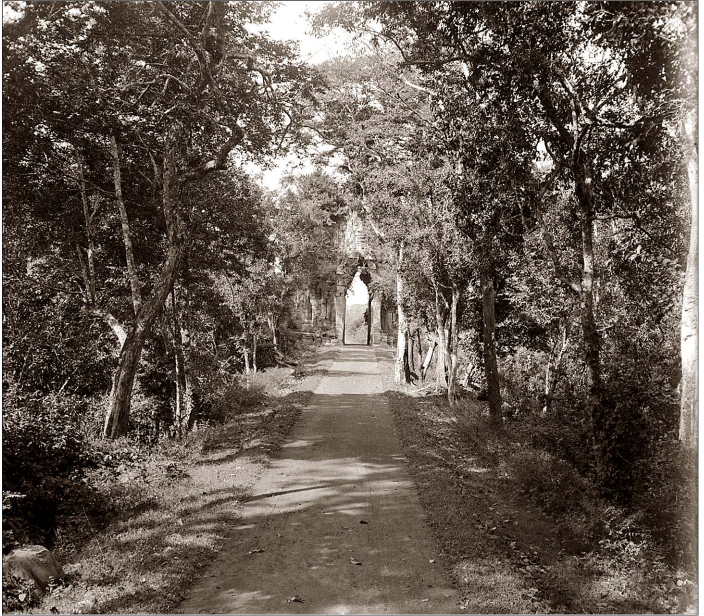
La porte d'Angkor Thom.