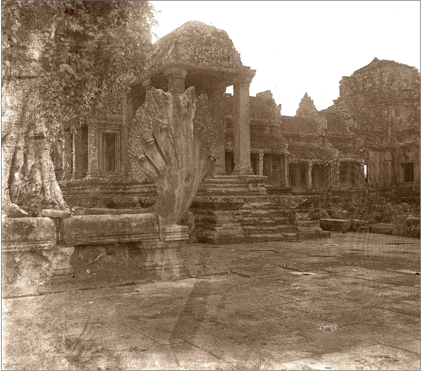
Angkor Vat - Dans le temple.