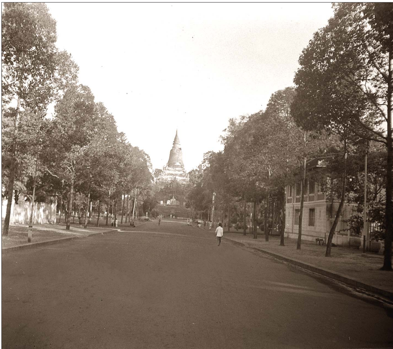
Phnom Penh - Le Wat Phnom, pagode bouddhiste.