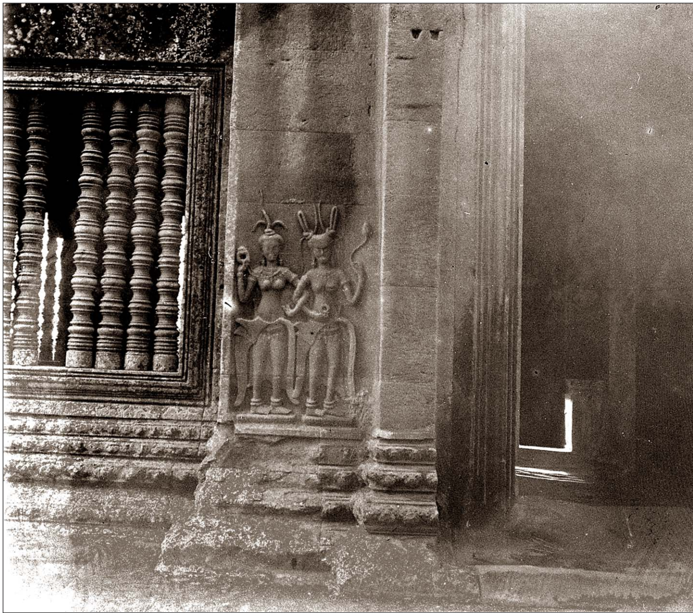
Angkor Vat - Tévdas.