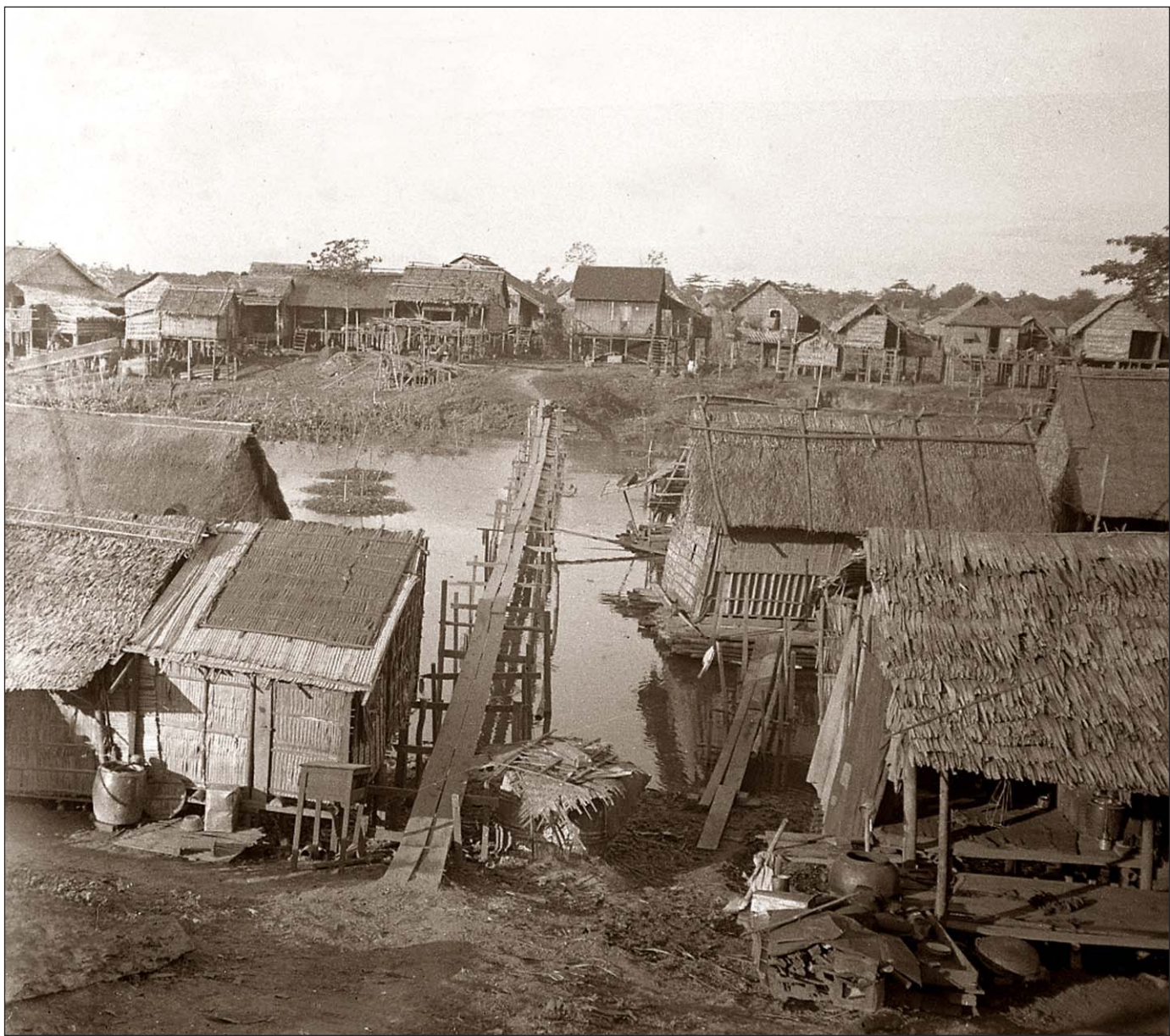
Village lacustre de Phnom Penh.