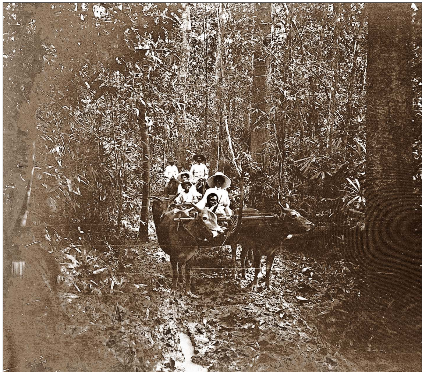
Charette à bœufs dans la forêt vierge.