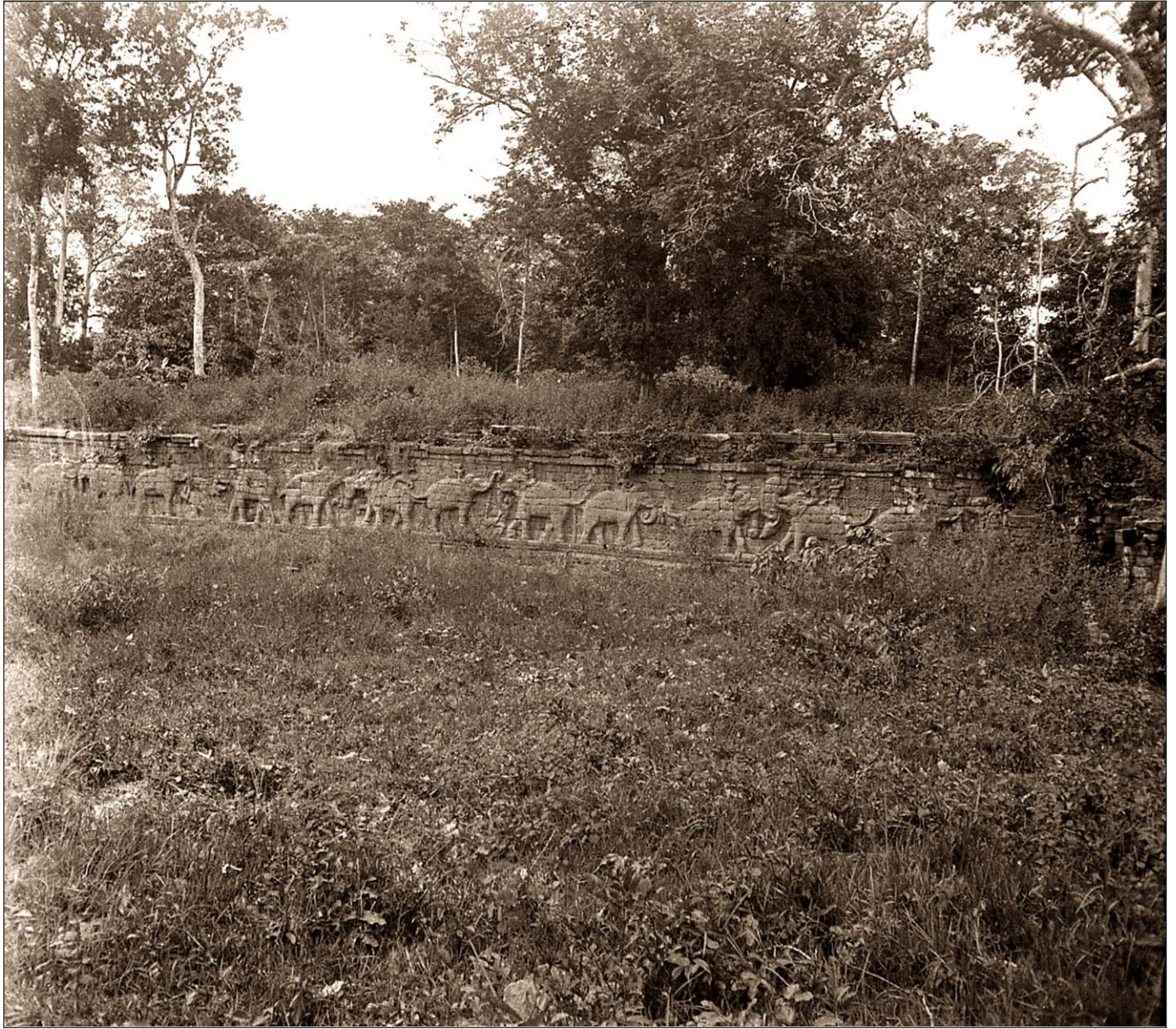
Angkor Thom - Terrasse des éléphants.