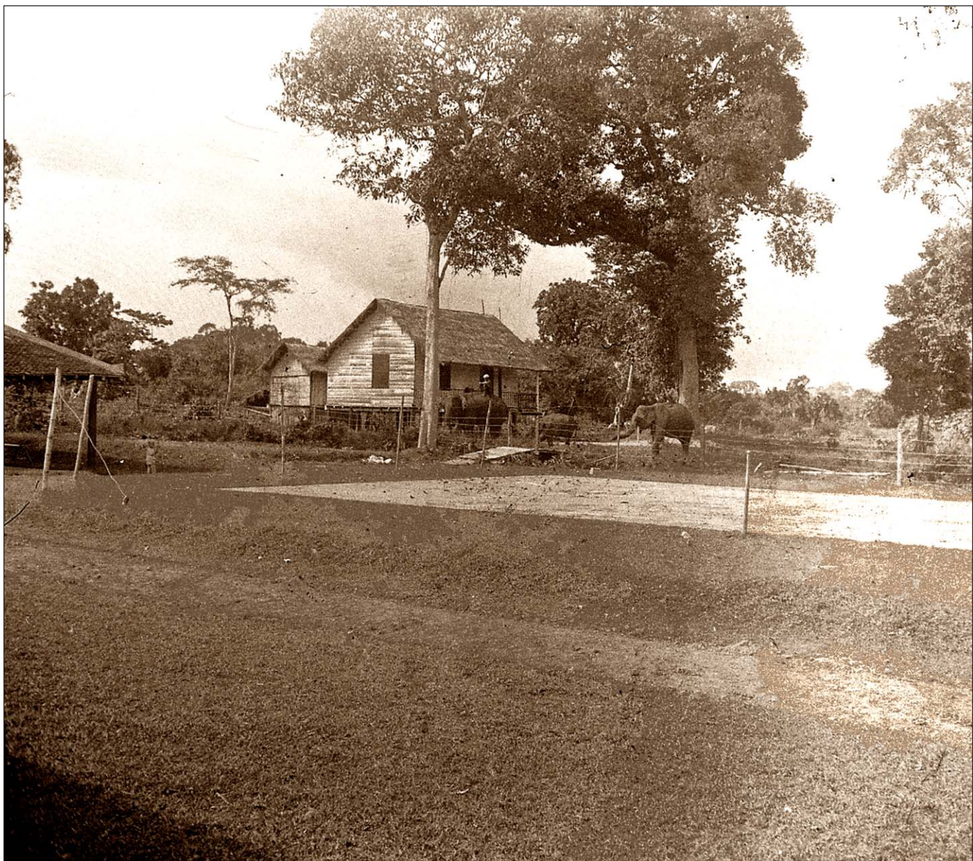
Éléphants près de la Sala (Angkor).