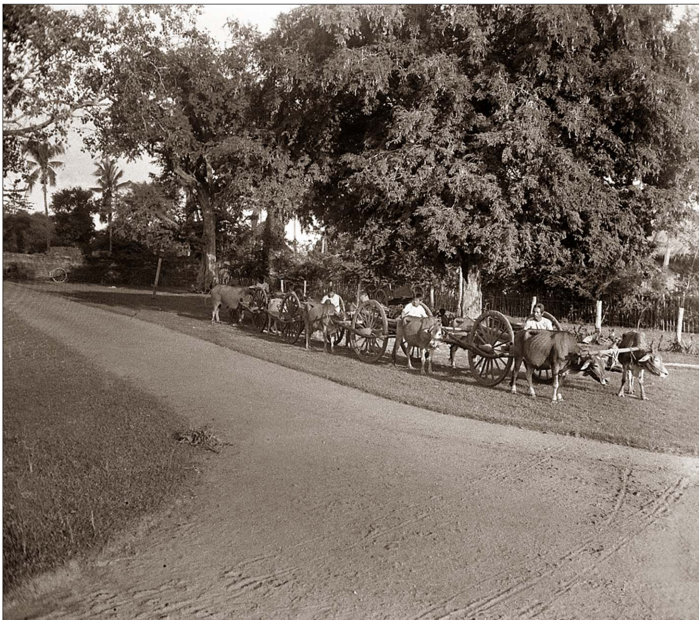
Siem Reap - Transport de bagages.