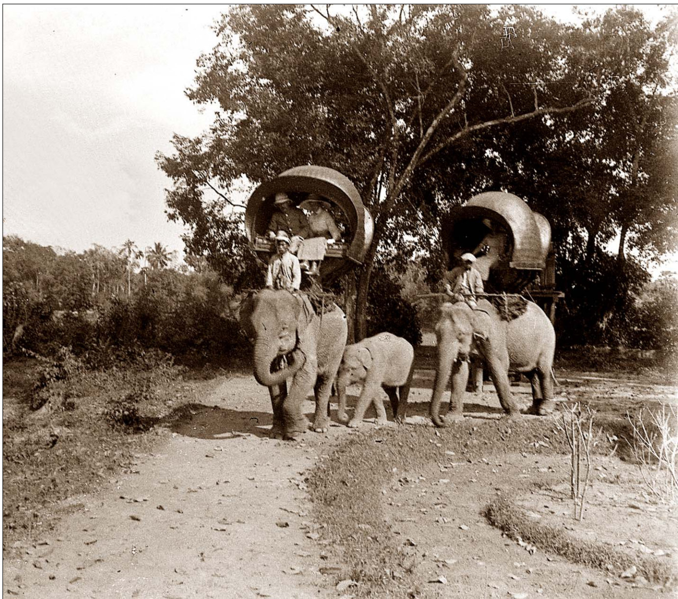
Angkor Thom - Éléphants en mouvement.