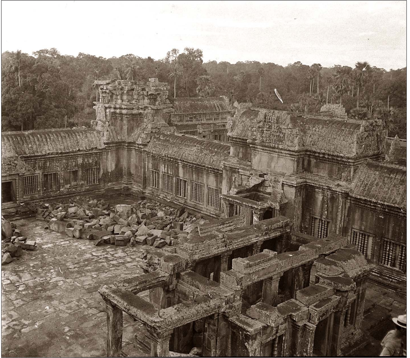
Angkor Vat - Vue plongeante prise du troisième étage.