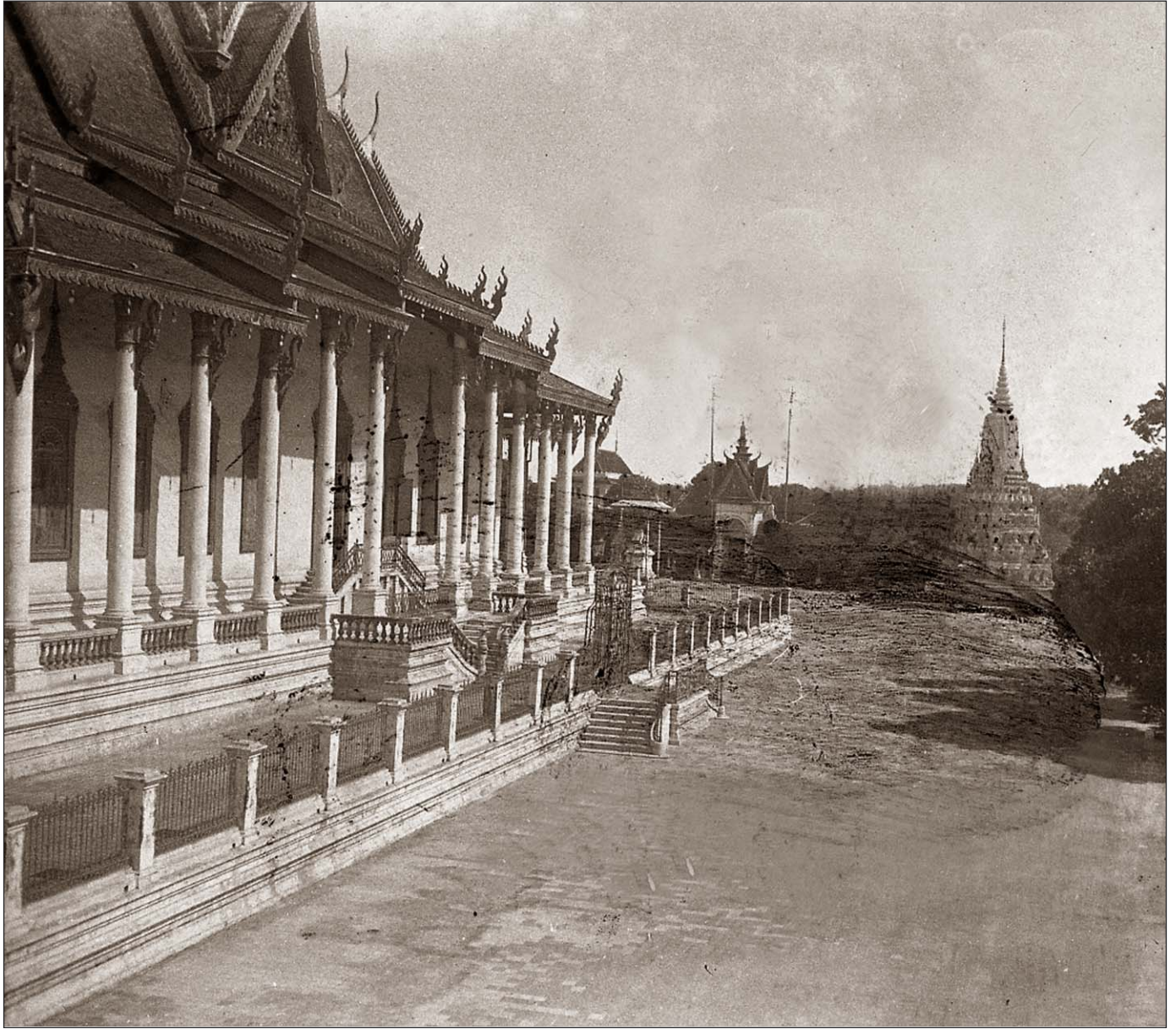
Phnom Penh - Palais royal.