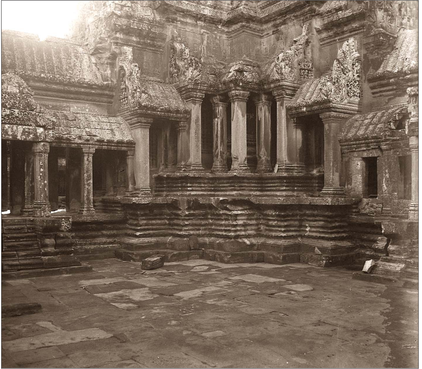
Angkor Vat - Piédestal du troisième étage (tour).