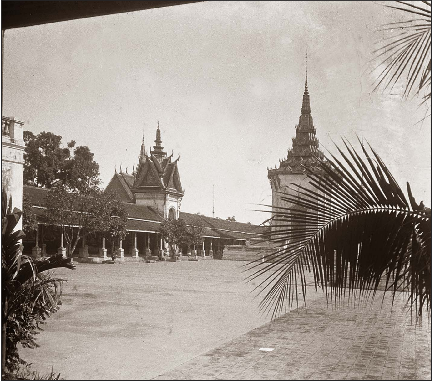
Phnom Penh - Palais royal.