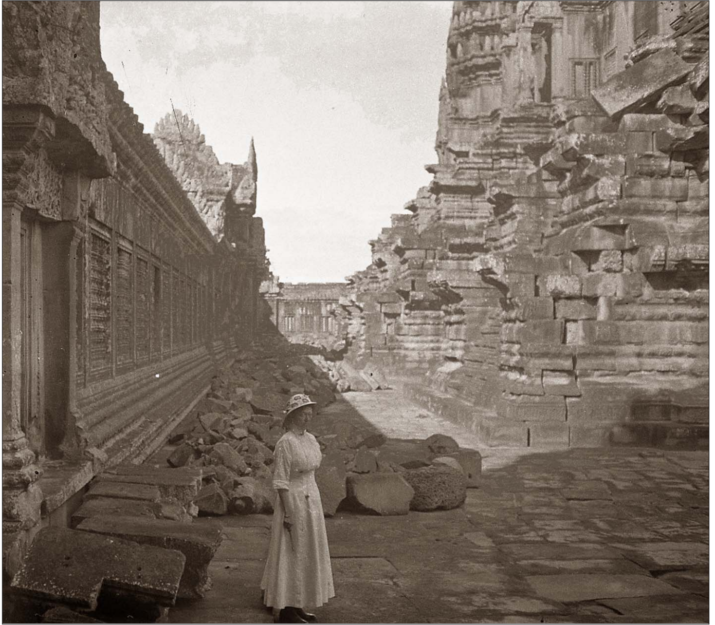
Angkor Vat - Dans la cour du deuxième étage.