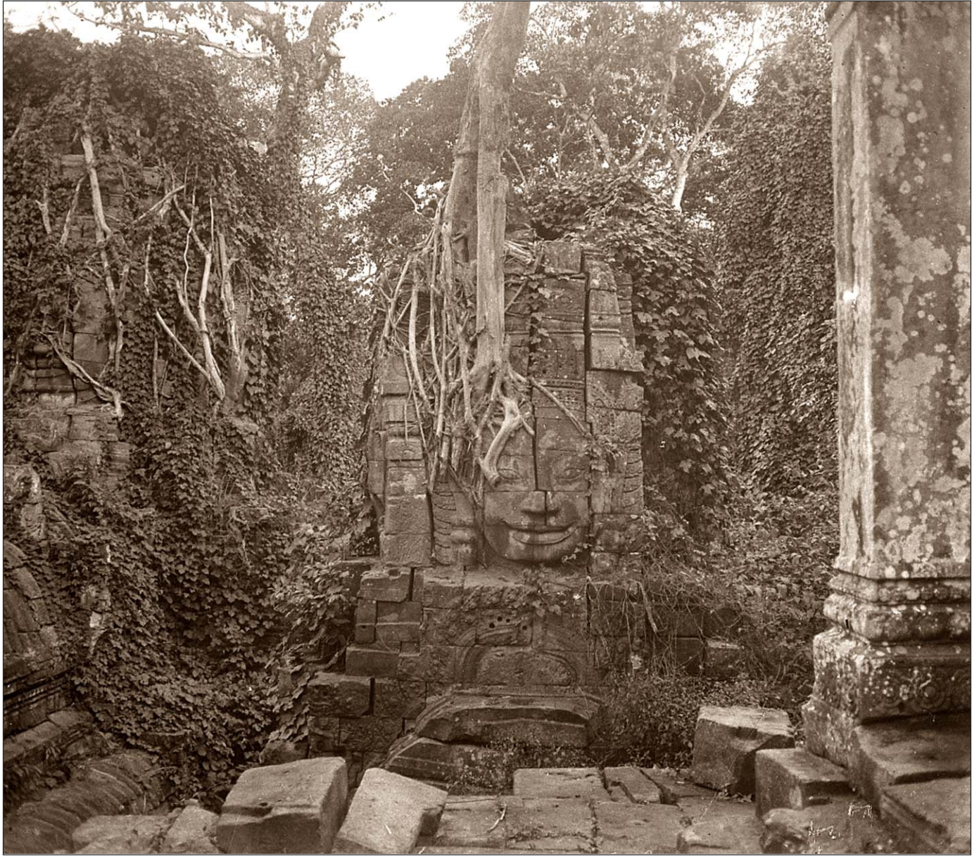
Angkor Thom - Intérieur du Bayon.