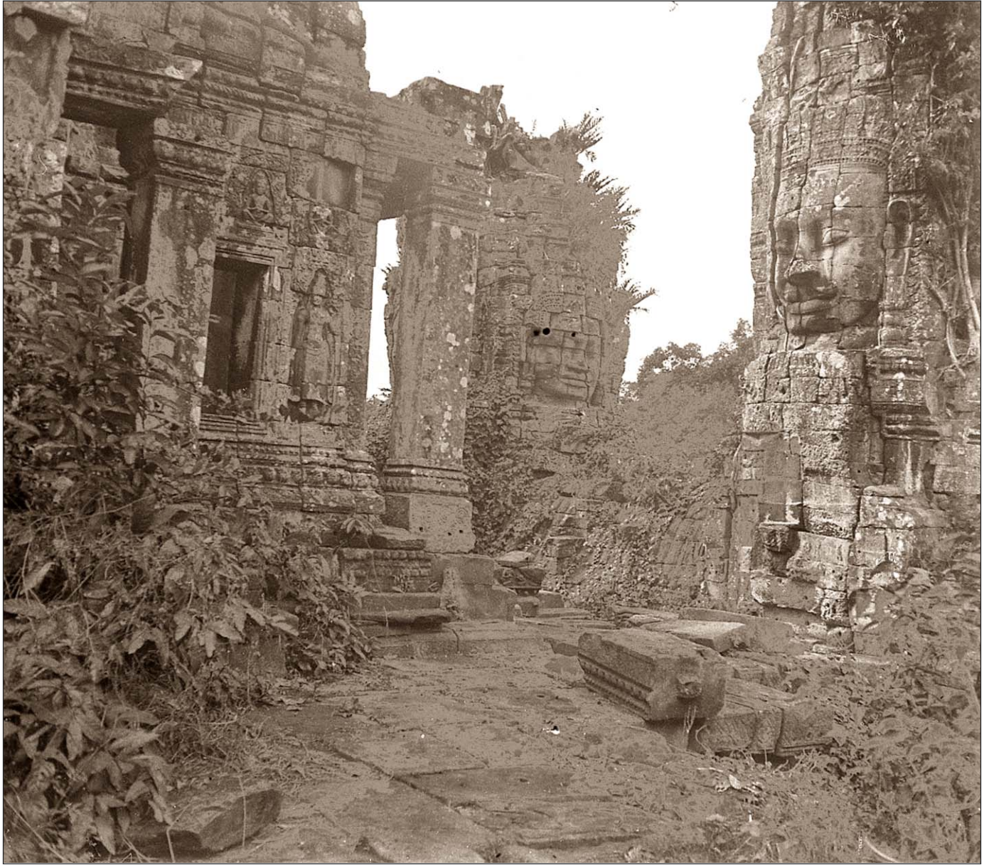
Angkor Thom - Intérieur grand du Bayon.