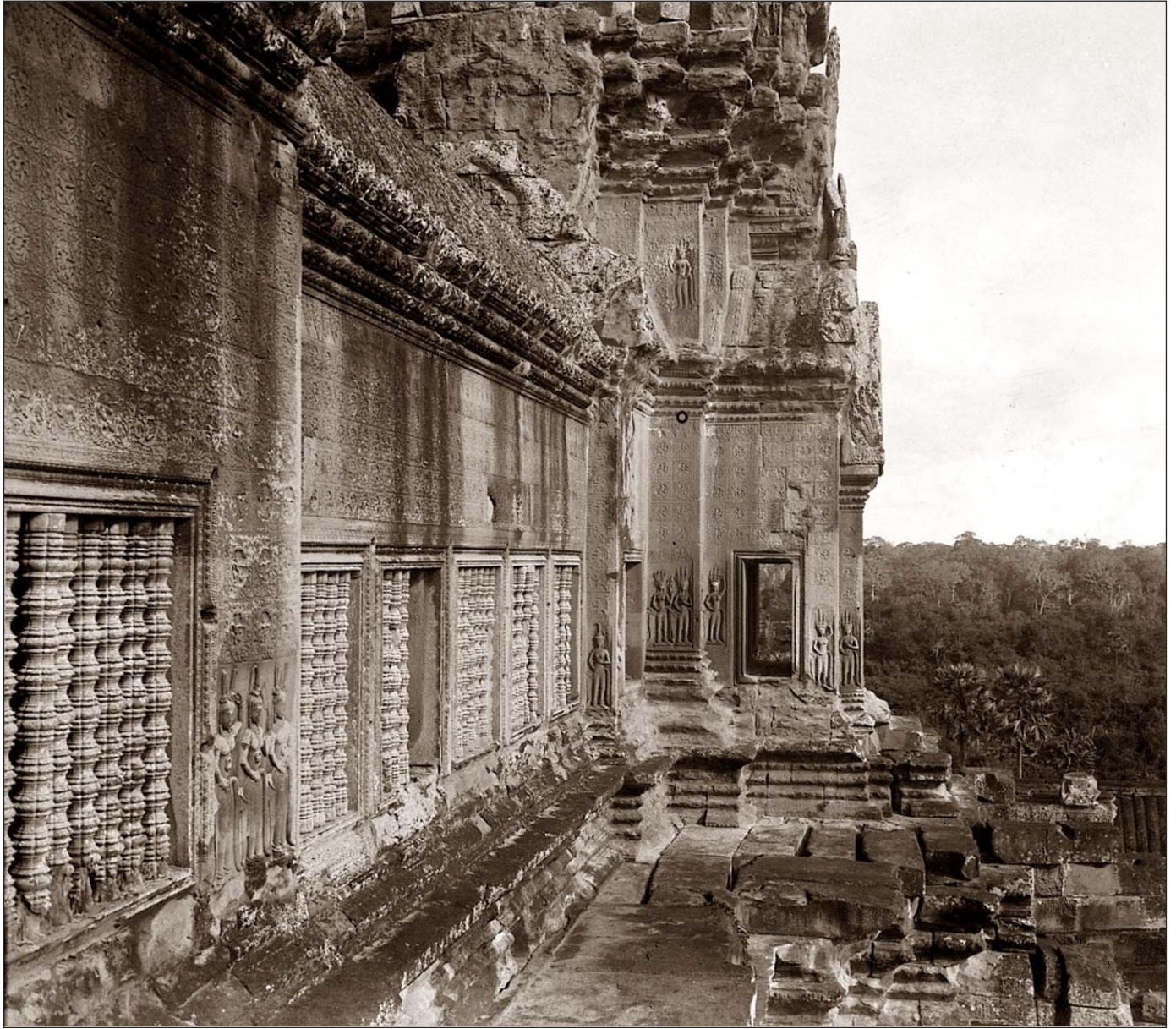
Angkor Vat - Galerie du troisième étage.