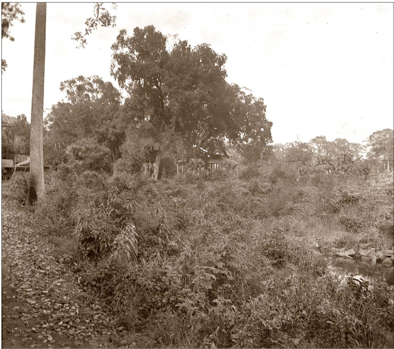
Angkor Thom - Village de Bonzes.