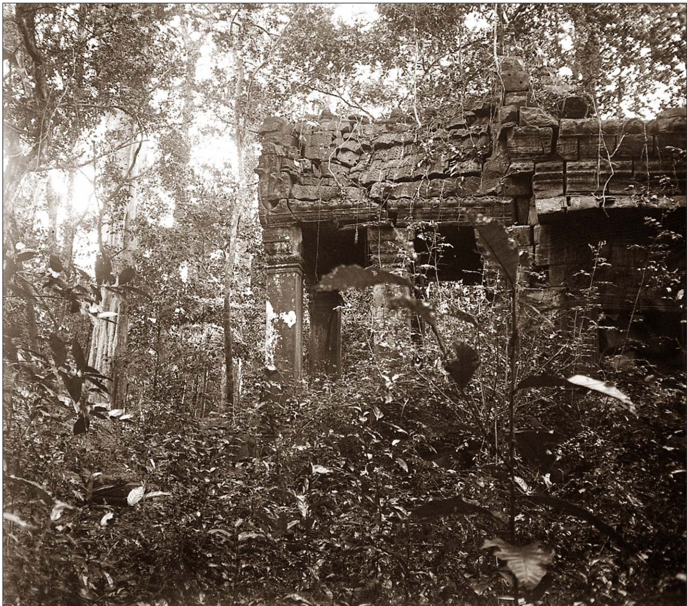
Ruines de Preah Khan (colonnes rondes).