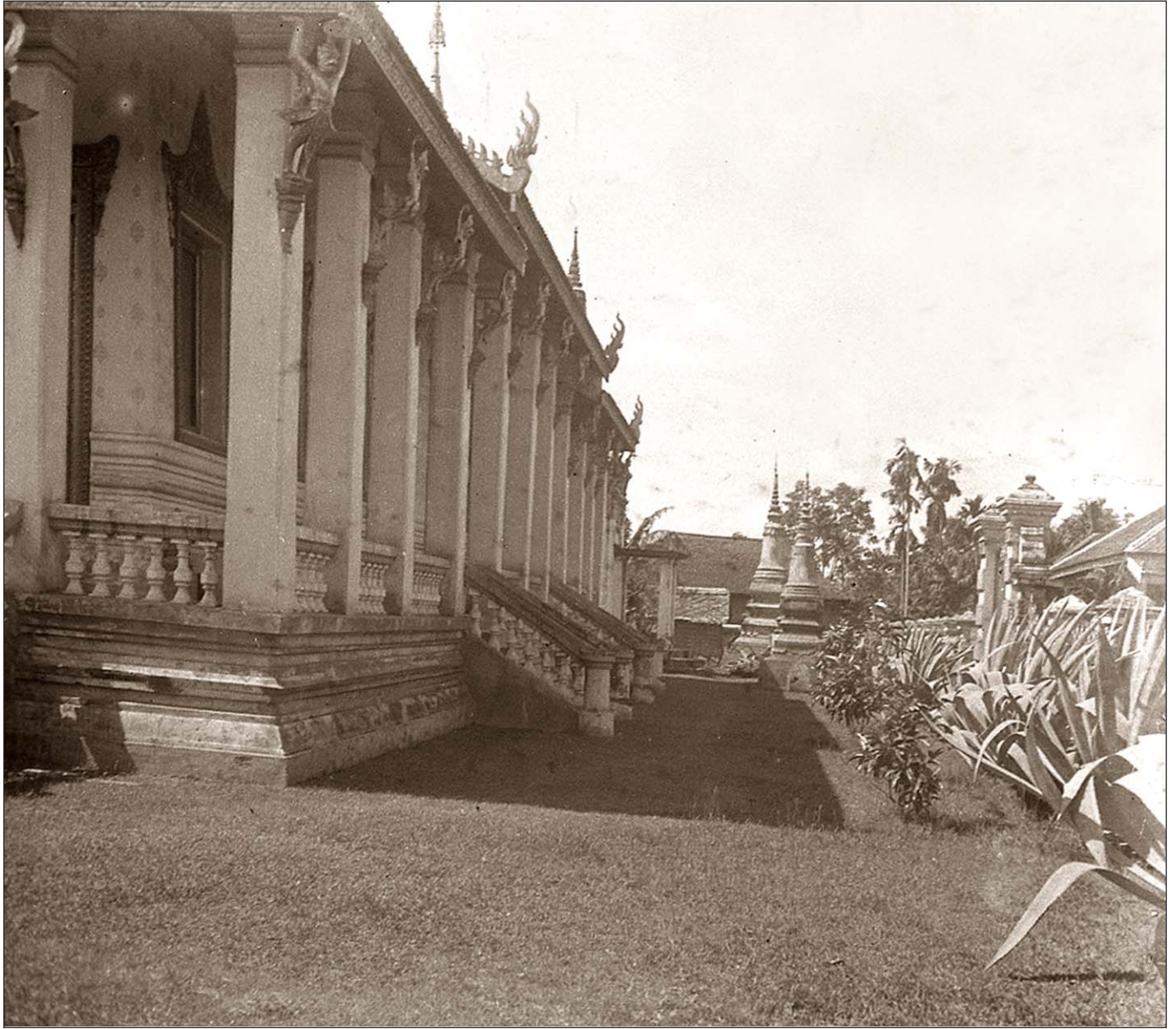
Phnom Penh - Palais royal.