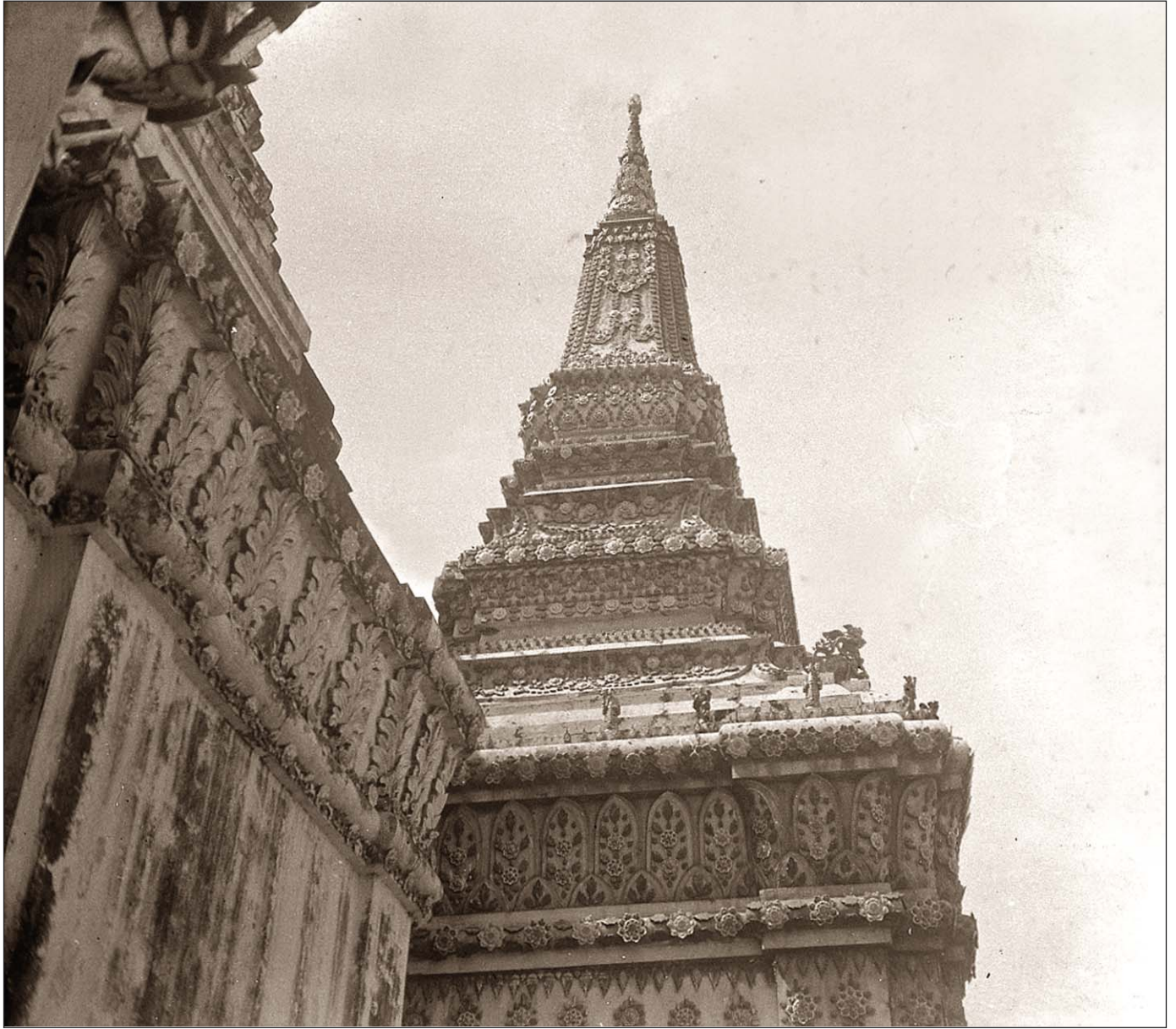
Phnom Penh - Une tour.