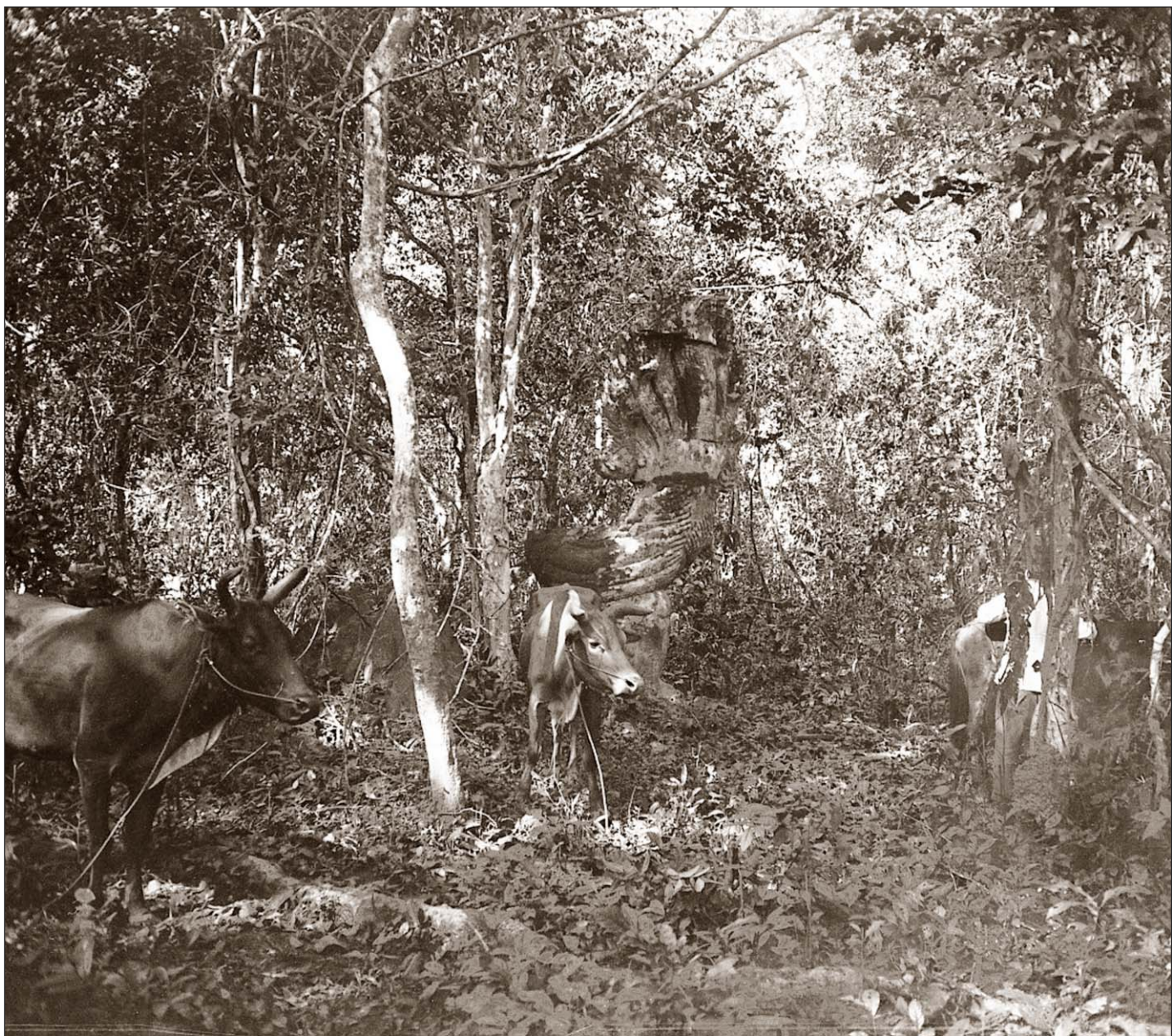
La Naja sacrée dans le bois.