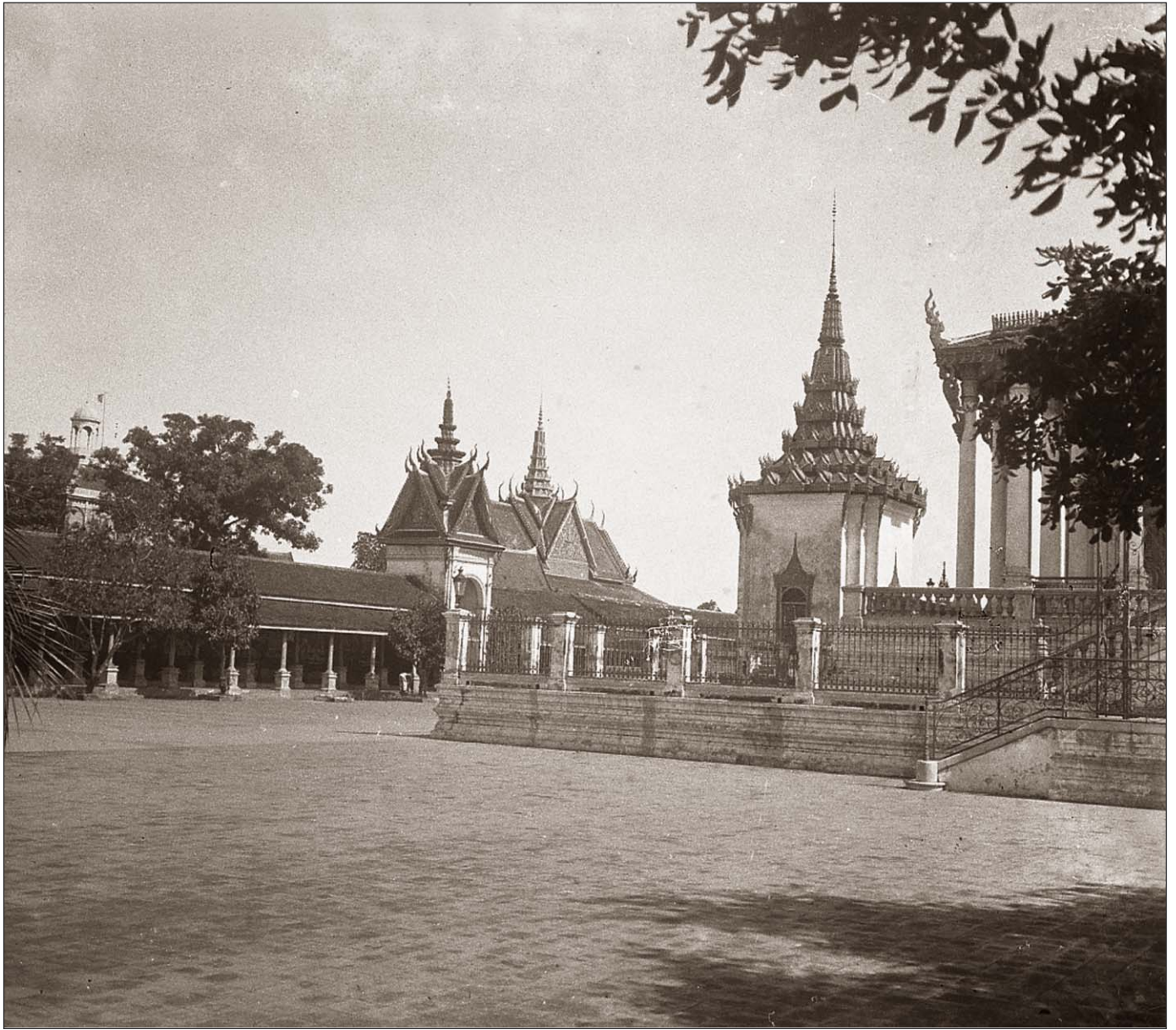
Phnom Penh - Palais royal.