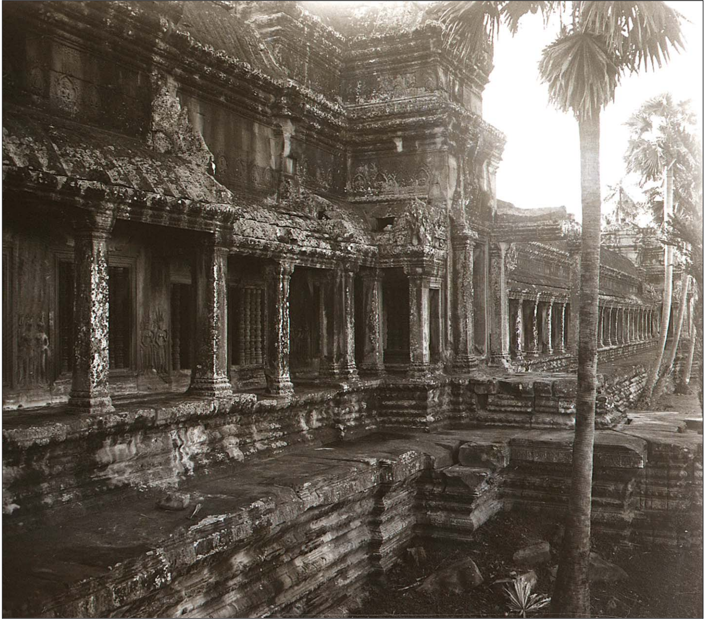
Ruines d'Angkor (Vat) - La belle galerie du premier étage.