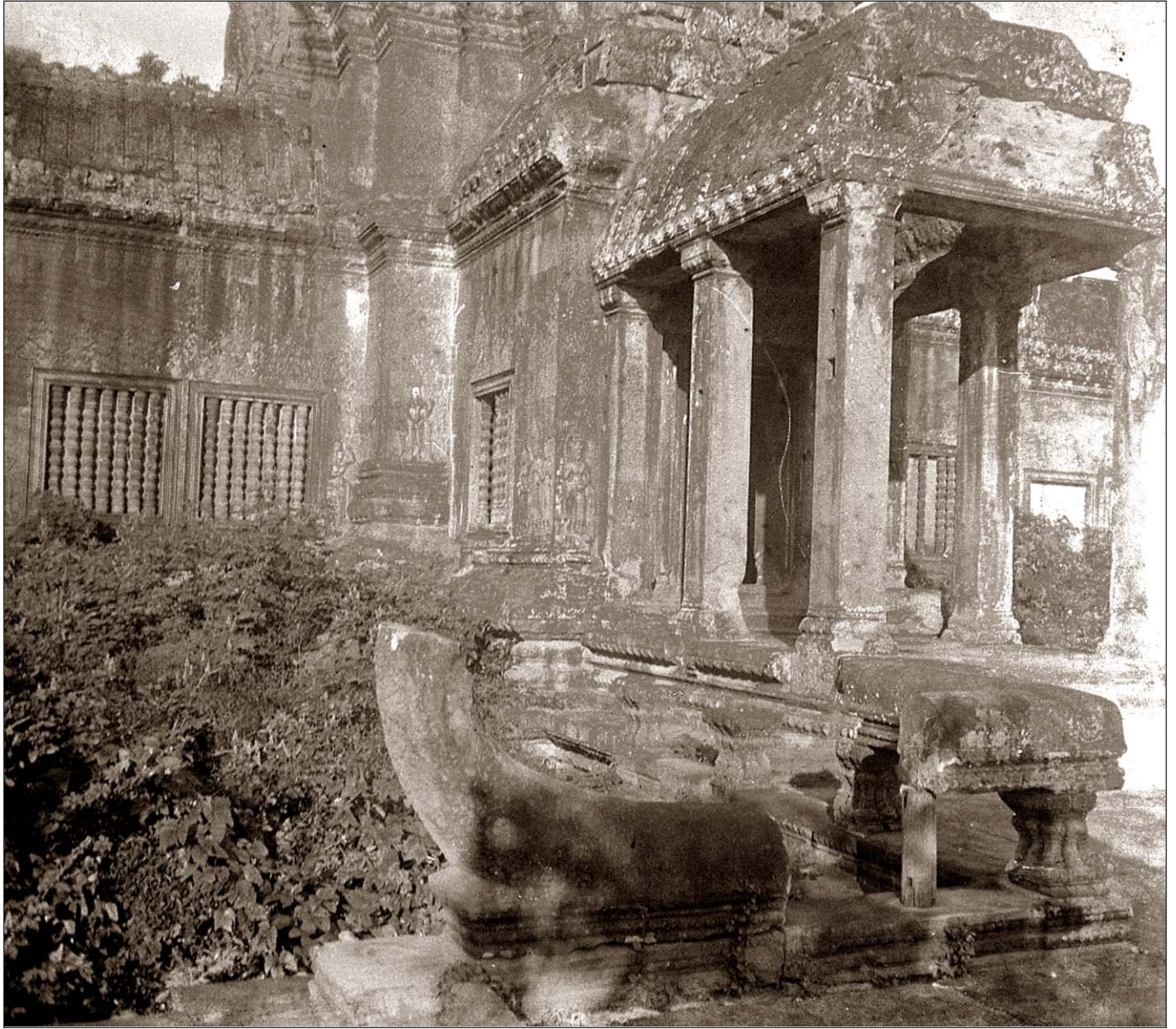
Ruines d'Angkor Vat.