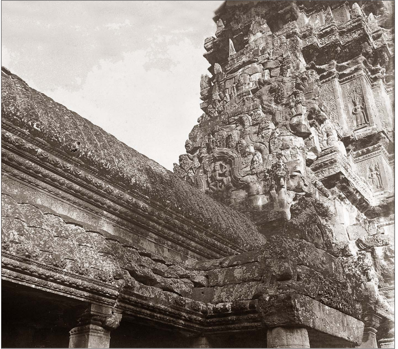
Angkor Vat - Détail d'une des tours.