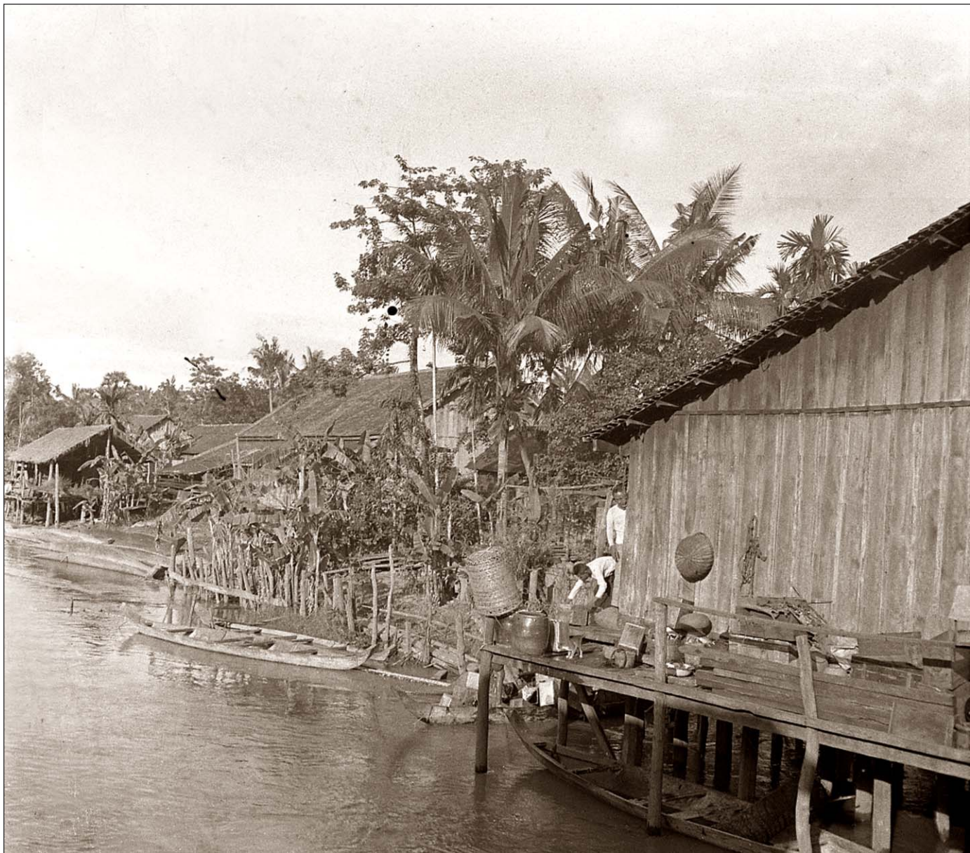
Le long de la rivière de Siem Reap.