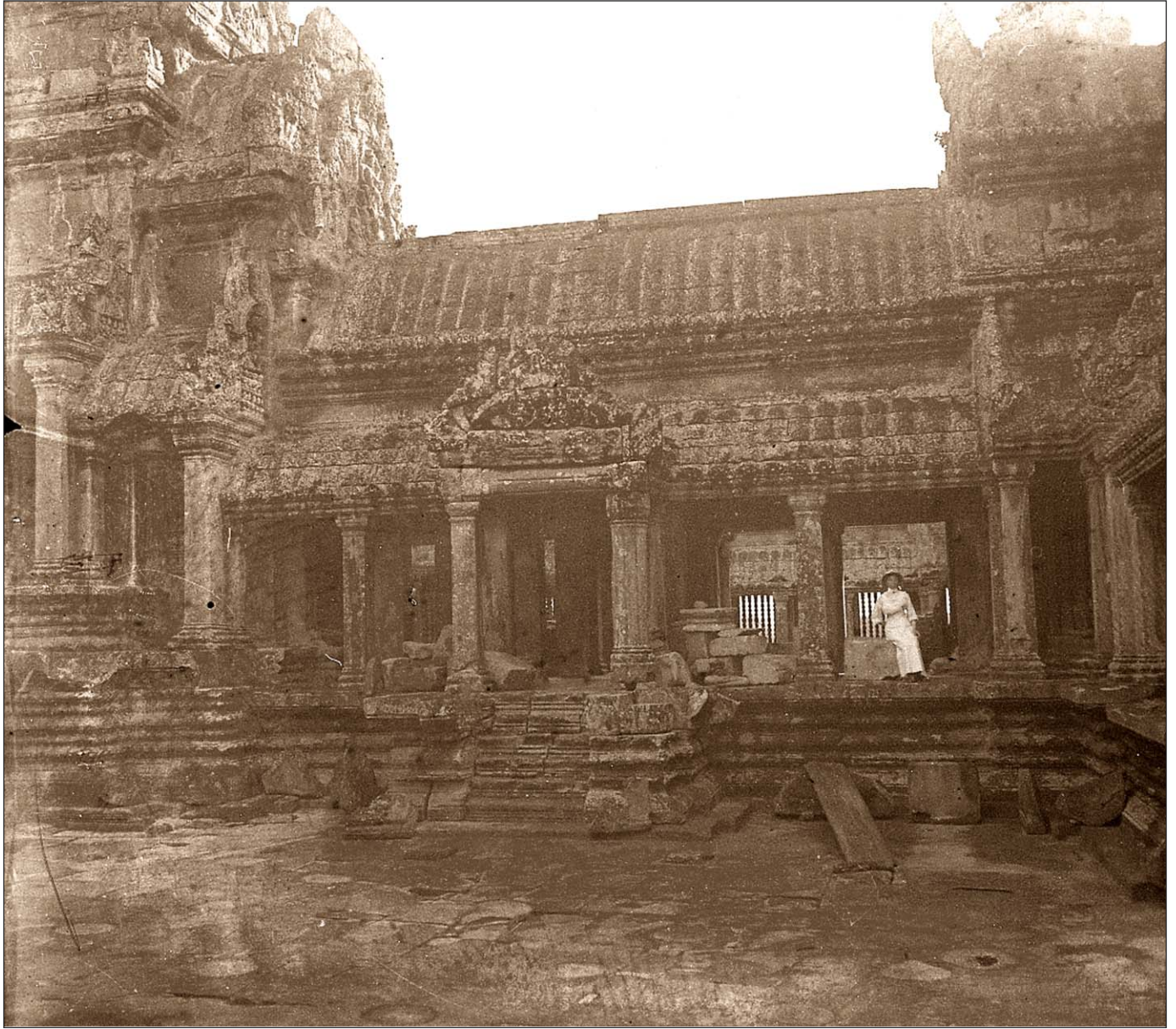
Angkor Vat - Dans le temple.