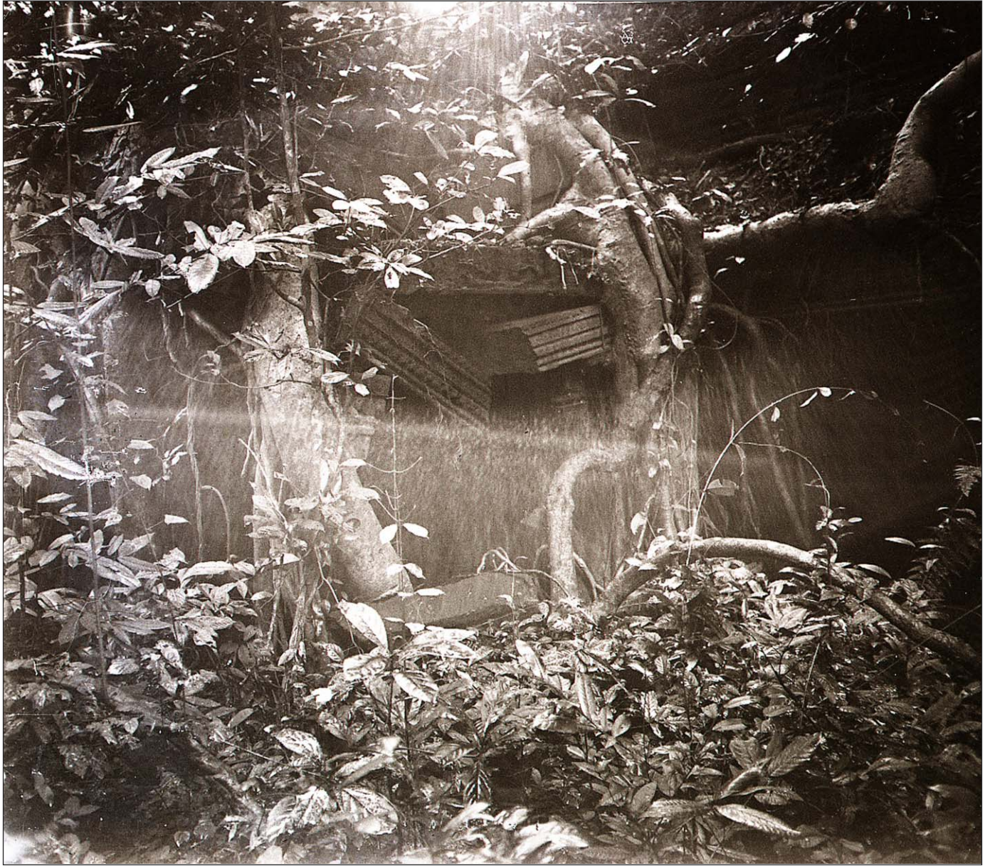
Ruines de Preah Khan.