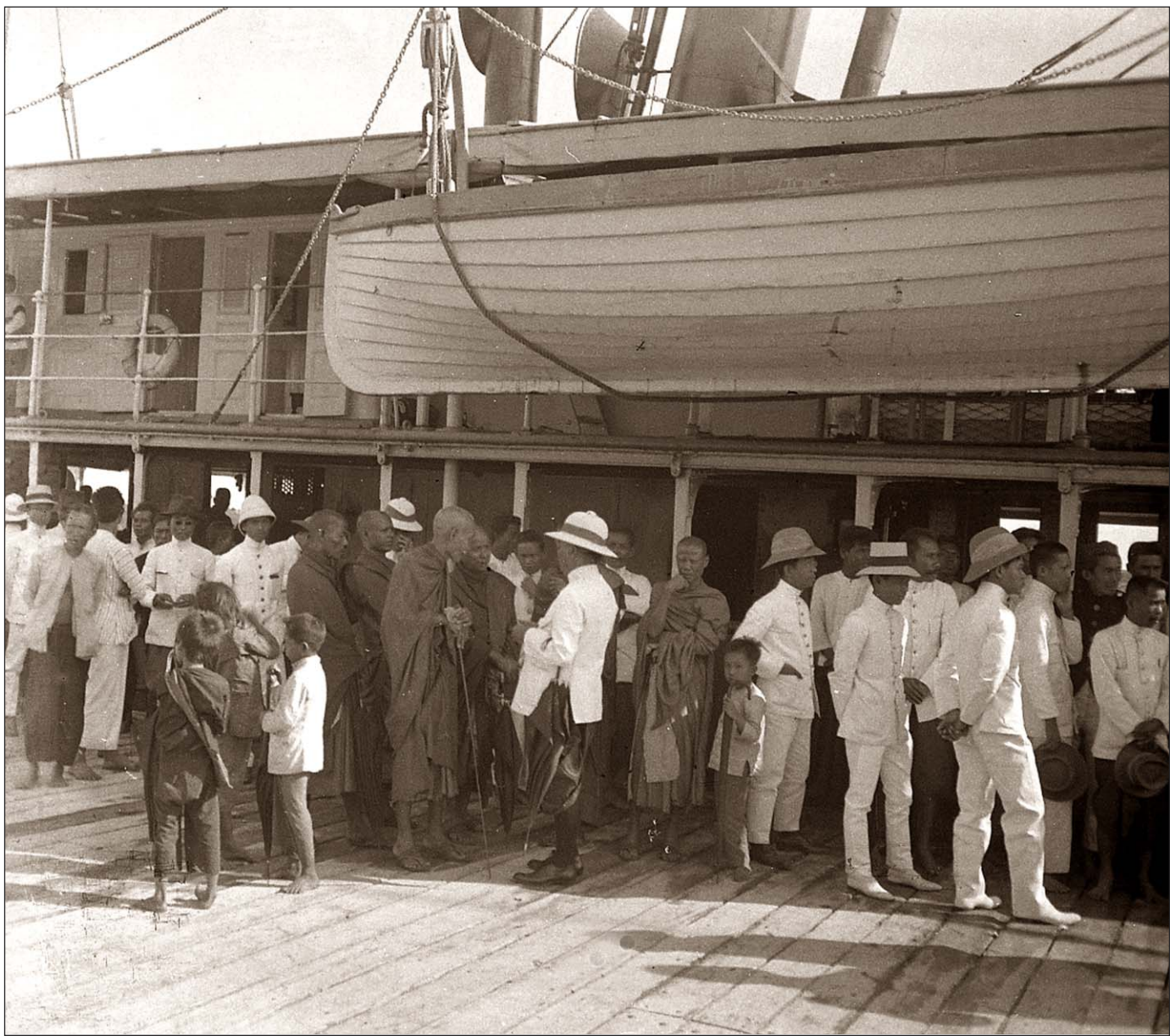
Groupe de bonzes au départ Nam Viam à Phnom Penh.