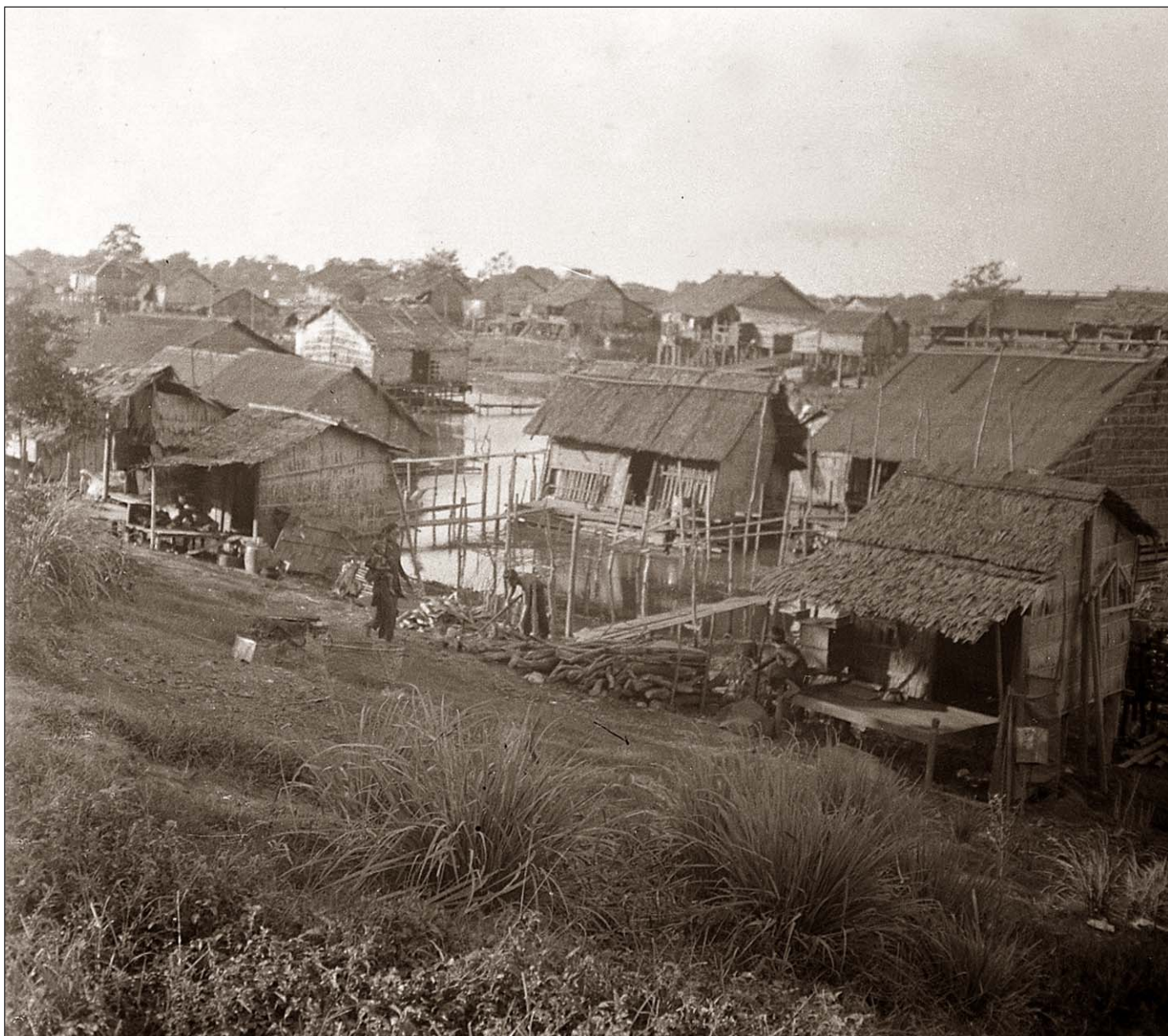
Village lacustre de Phnom Penh.