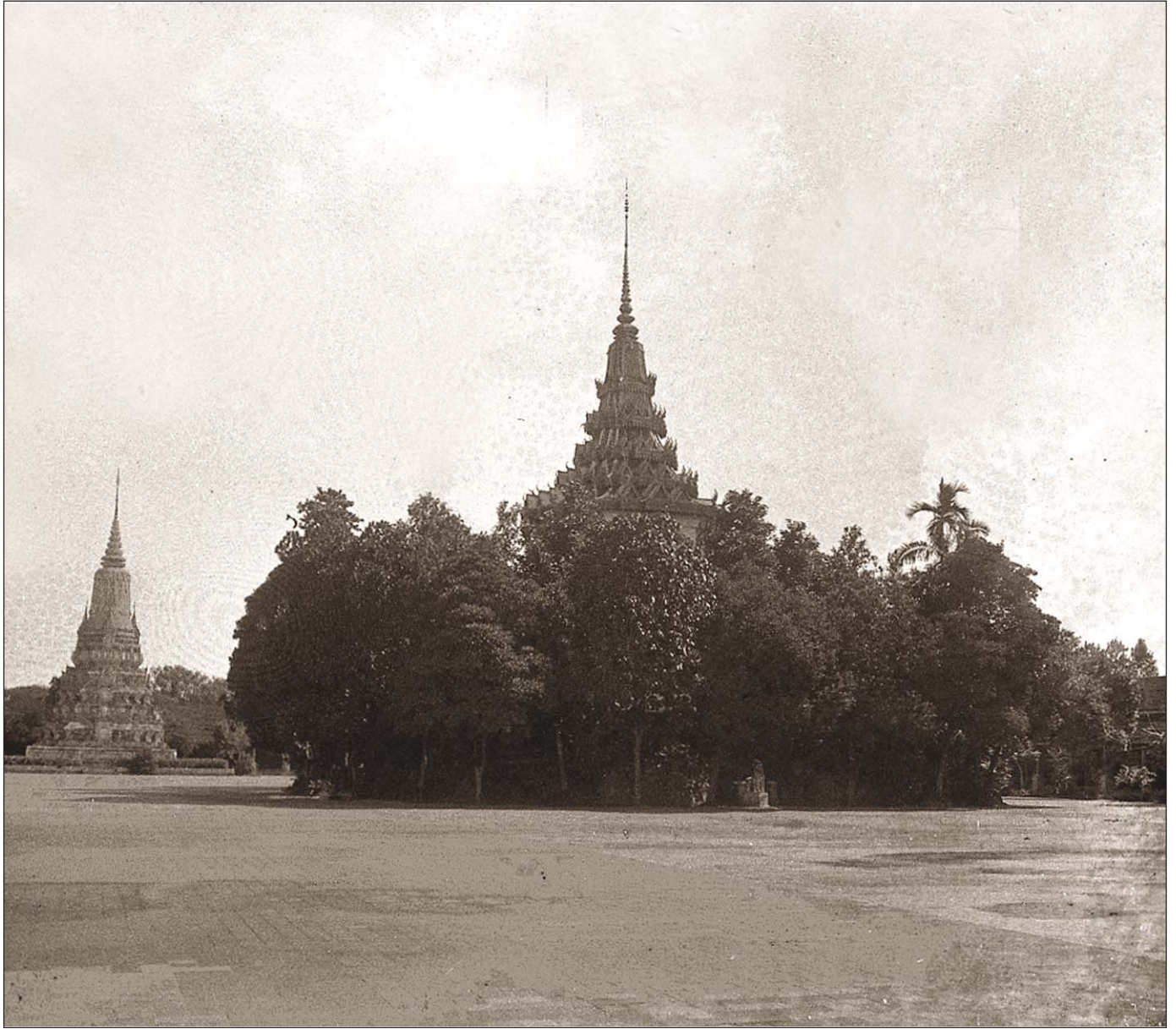
Phnom Penh - Une pagode.