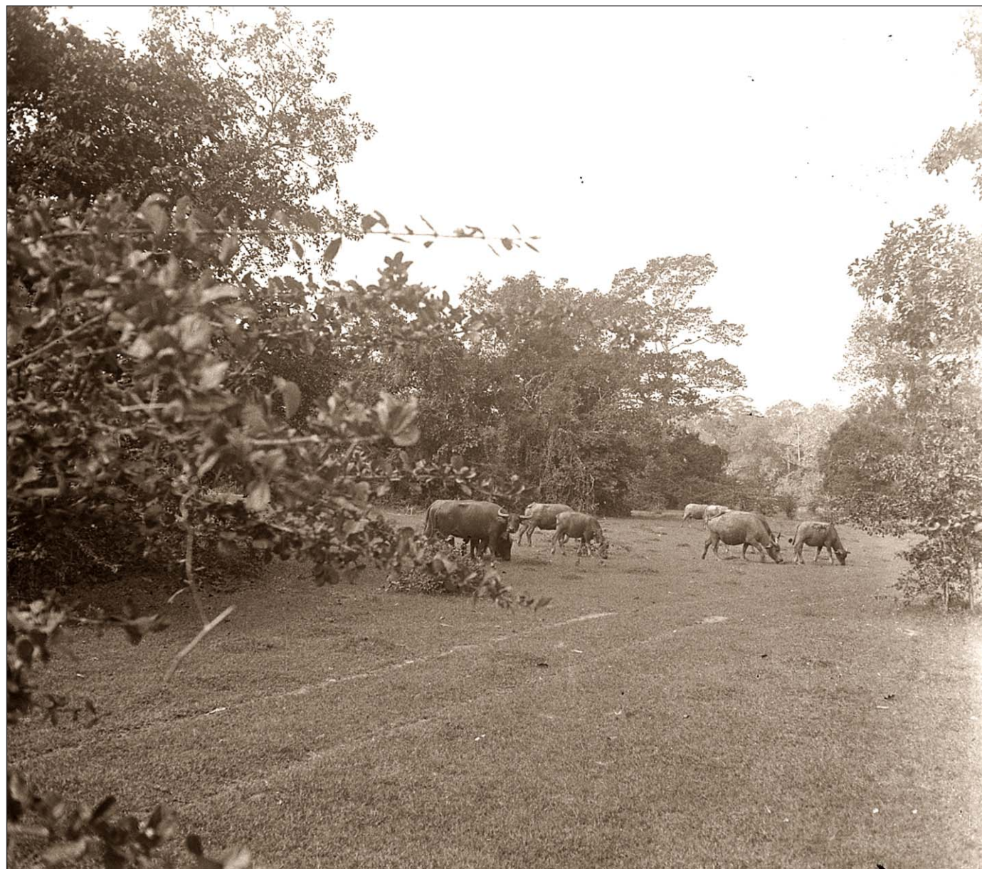
Buffles près d'Angkor.