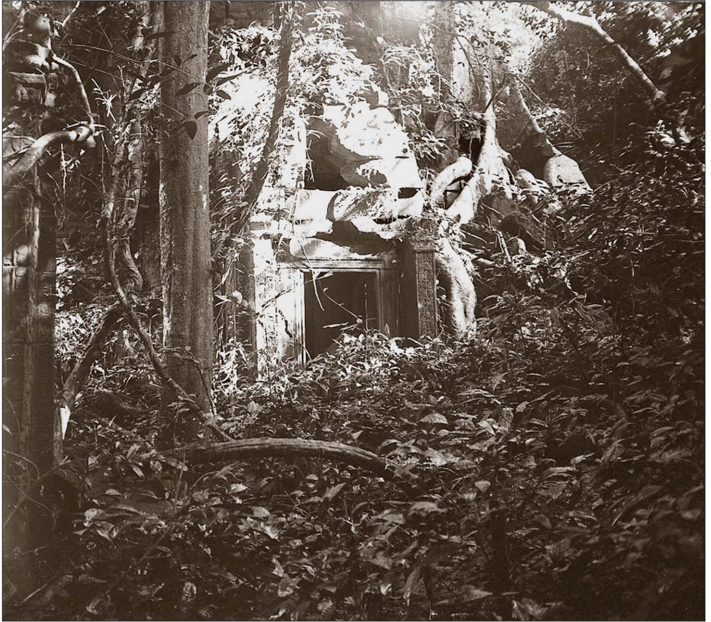
Ruines de Preah Khan.