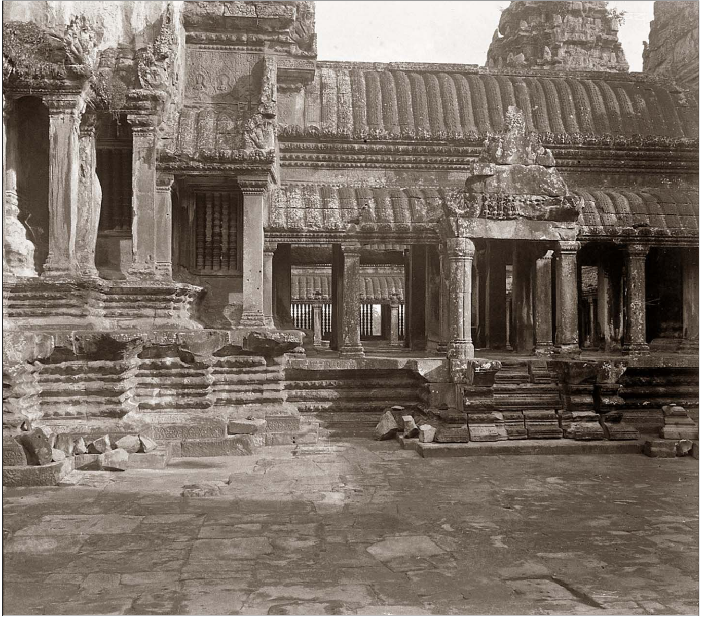
Ruines d'Angkor Vat.