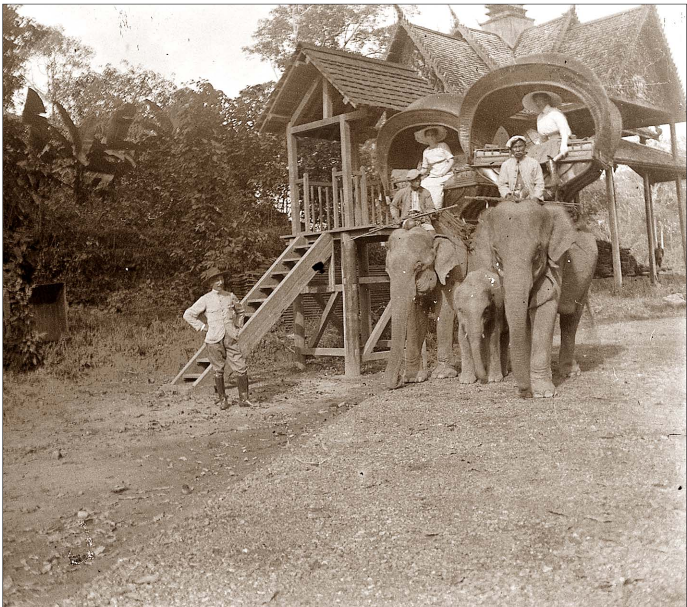
Angkor Thom - Eléphants près de l'escalier.