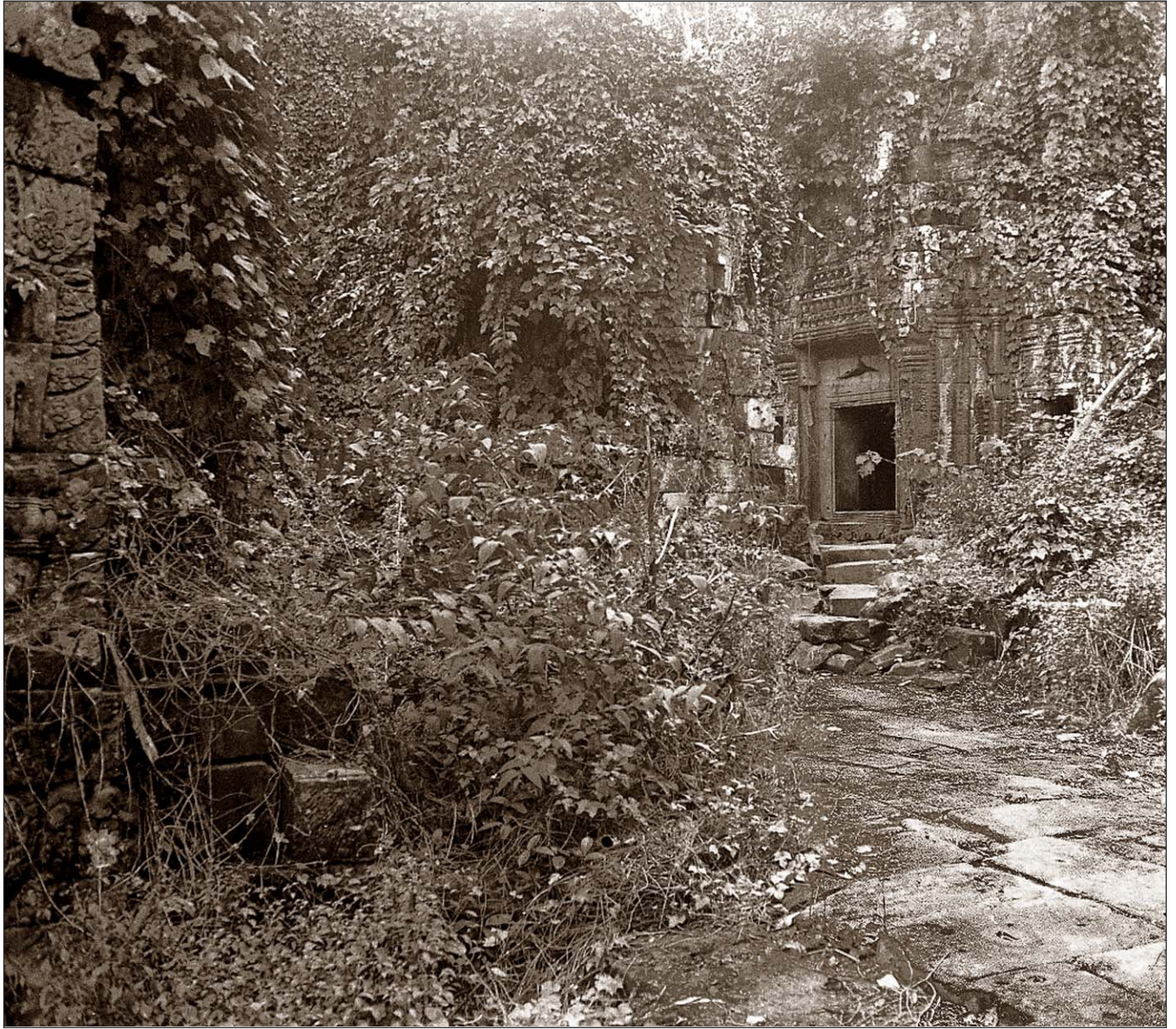
Angkor Thom - Intérieur envahi par la végétation.