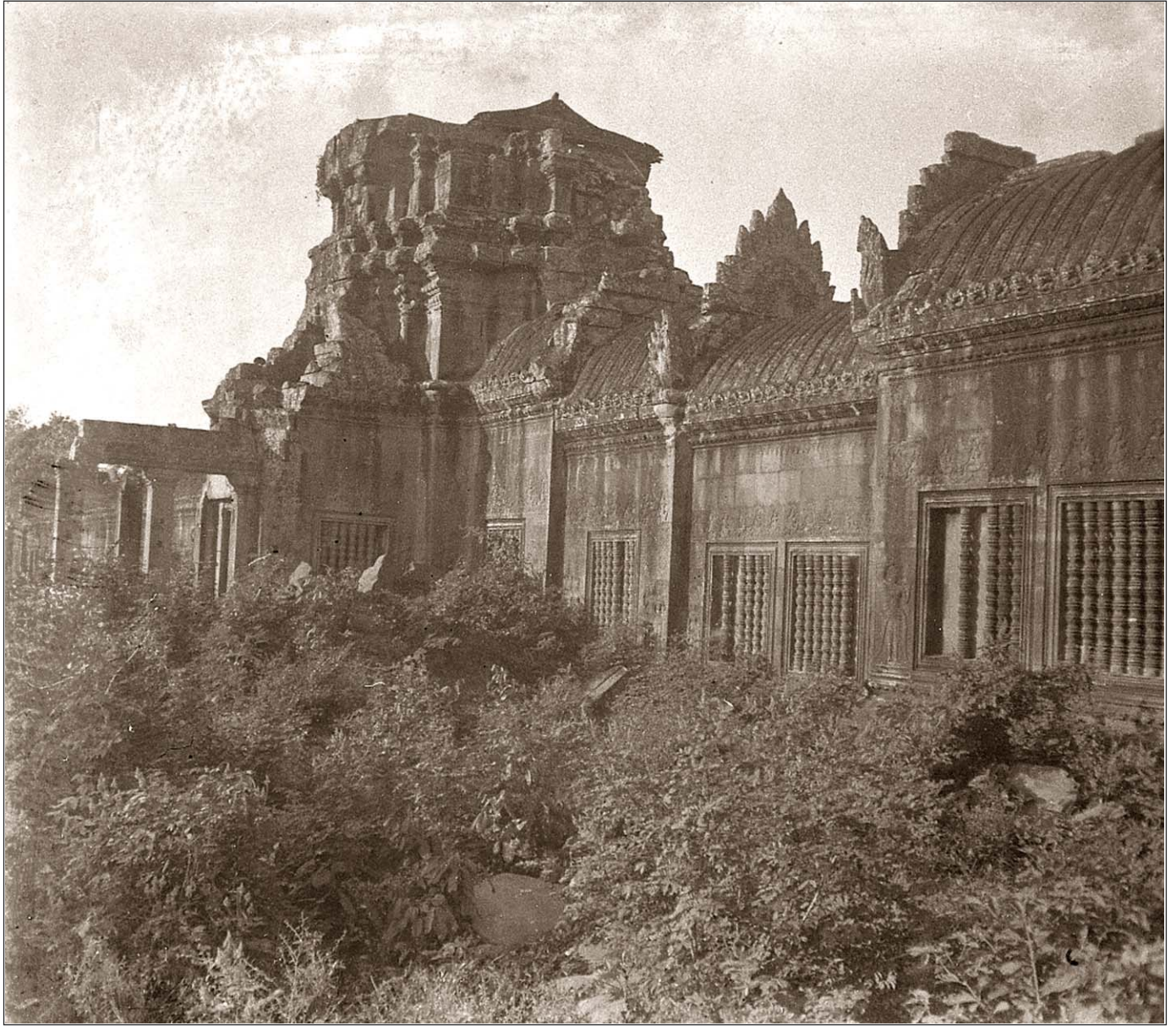
Angkor Vat - Nombreux arbres et buissons.