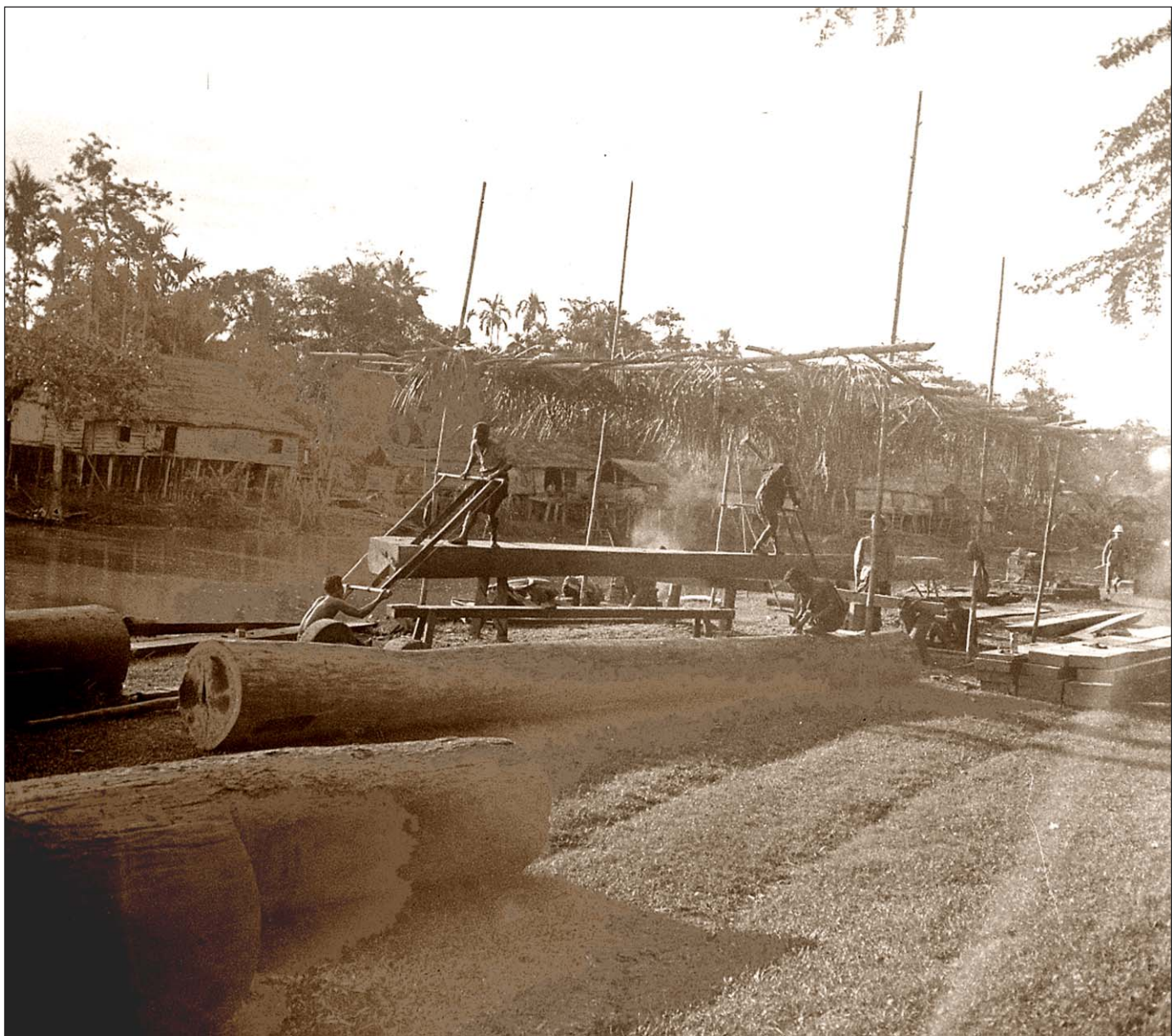
Siem Reap - Scierie chinoise.