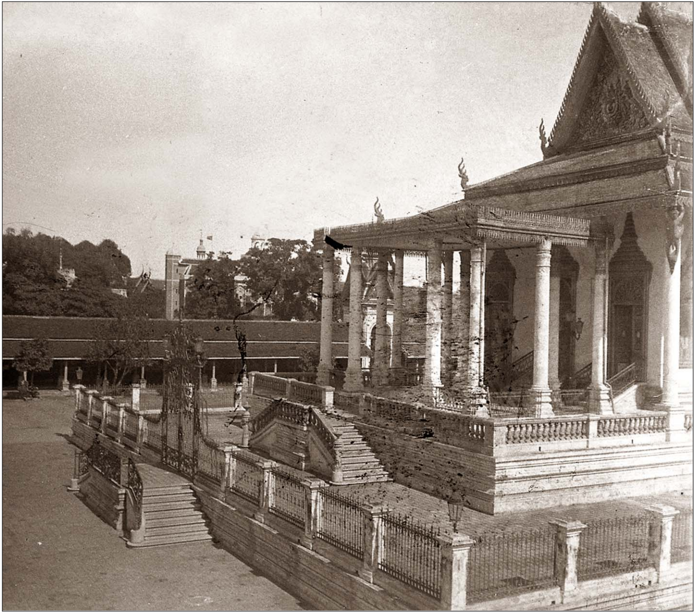
Phnom Penh - Palais royal.