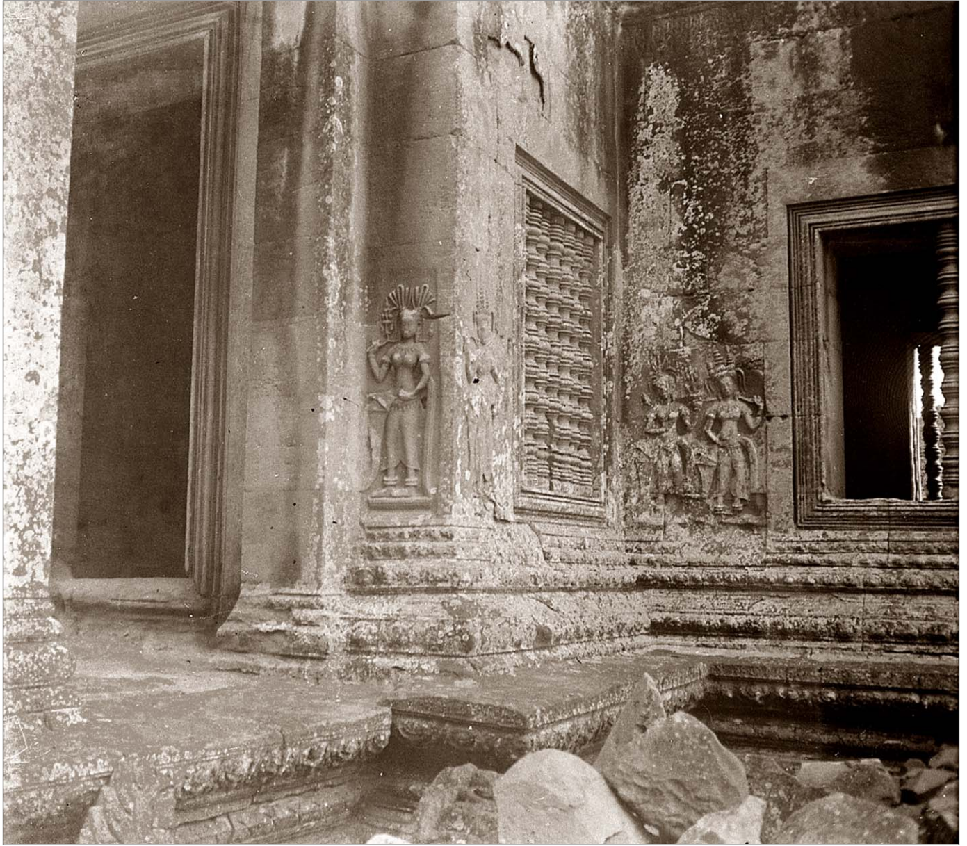
Angkor Vat - Tévasas.