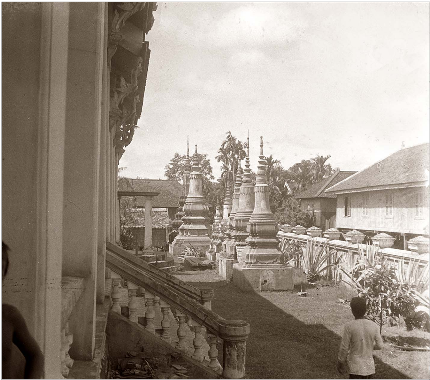
Phnom Penh - Dans le Palais royal.