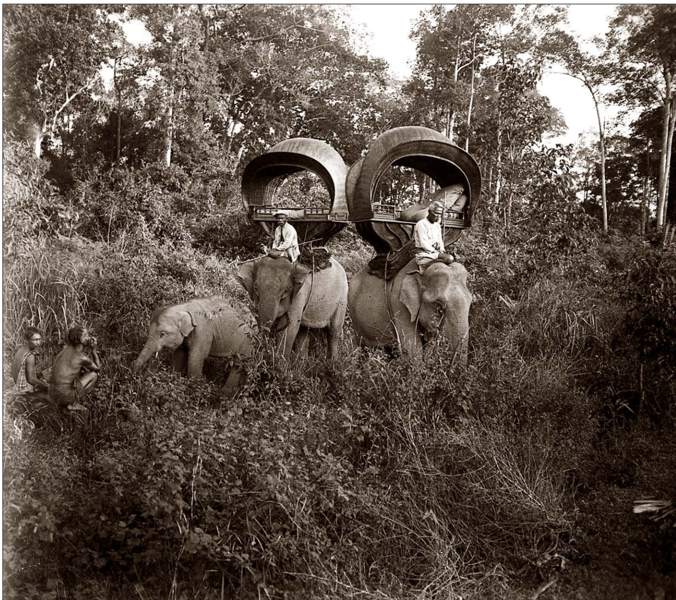
Angkor Thom - Éléphants dans la brousse.