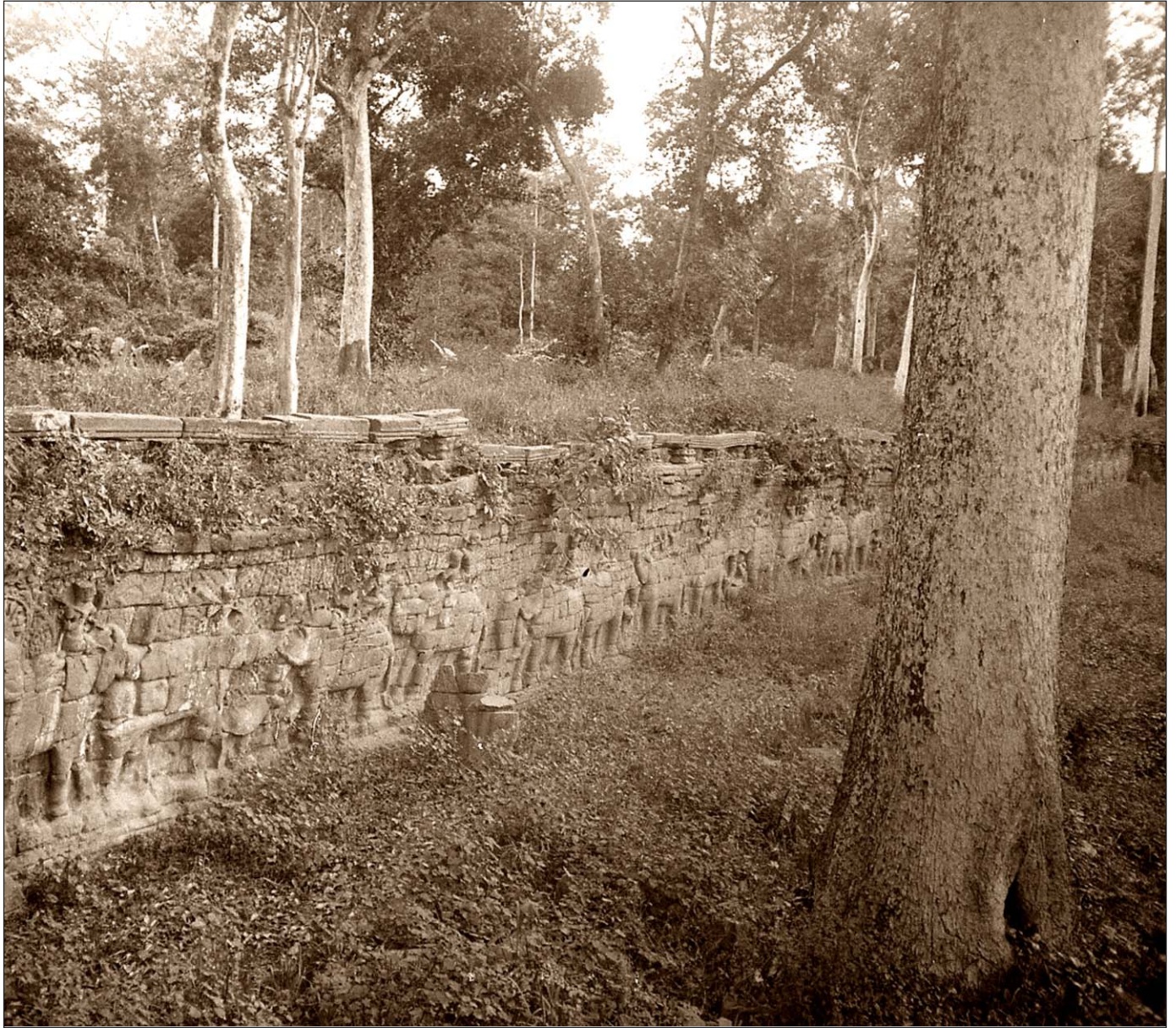
Angkor Thom - Terrasse des éléphants.