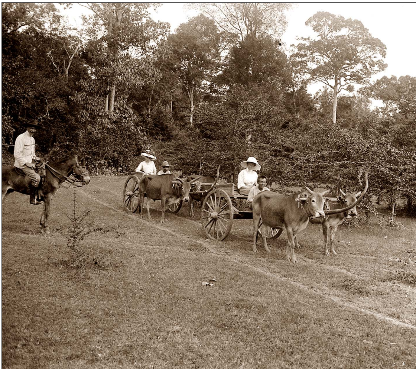
Charettes à bœufs dans la forêt vierge.