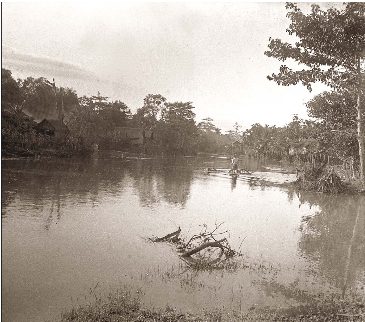
Siem Reap - Bœufs traversant la rivière.