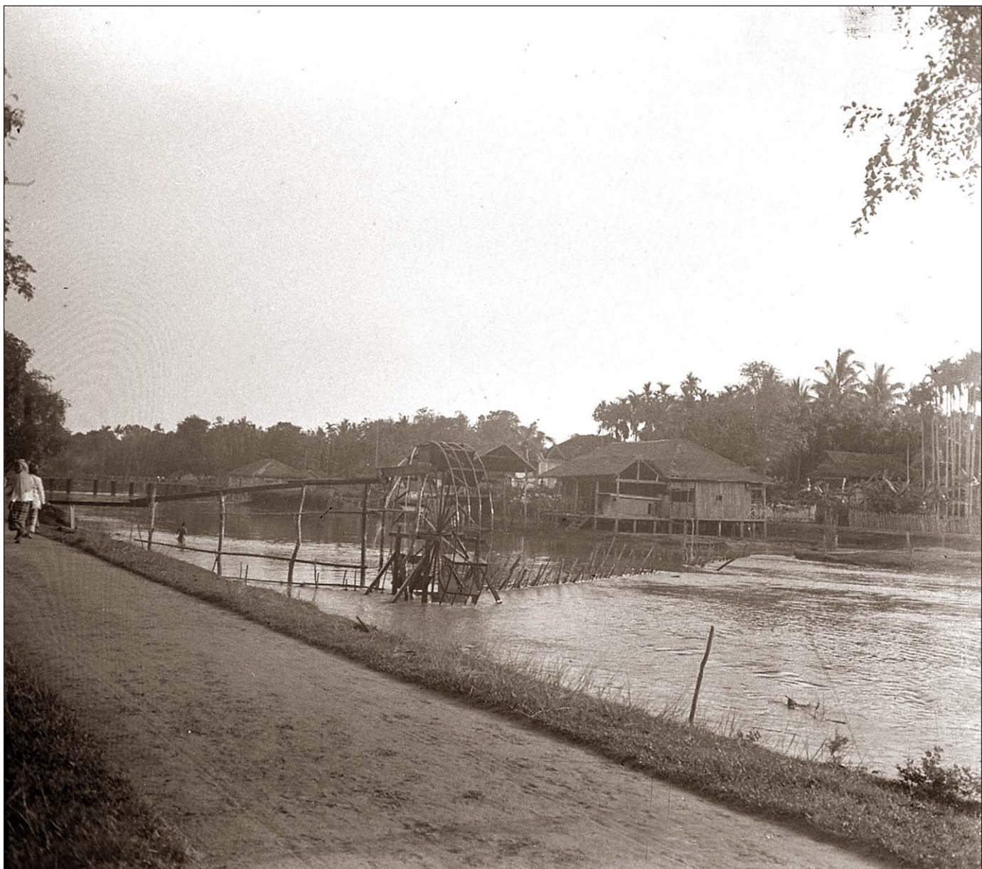
Siem Reap - Noria ou roue à eau.