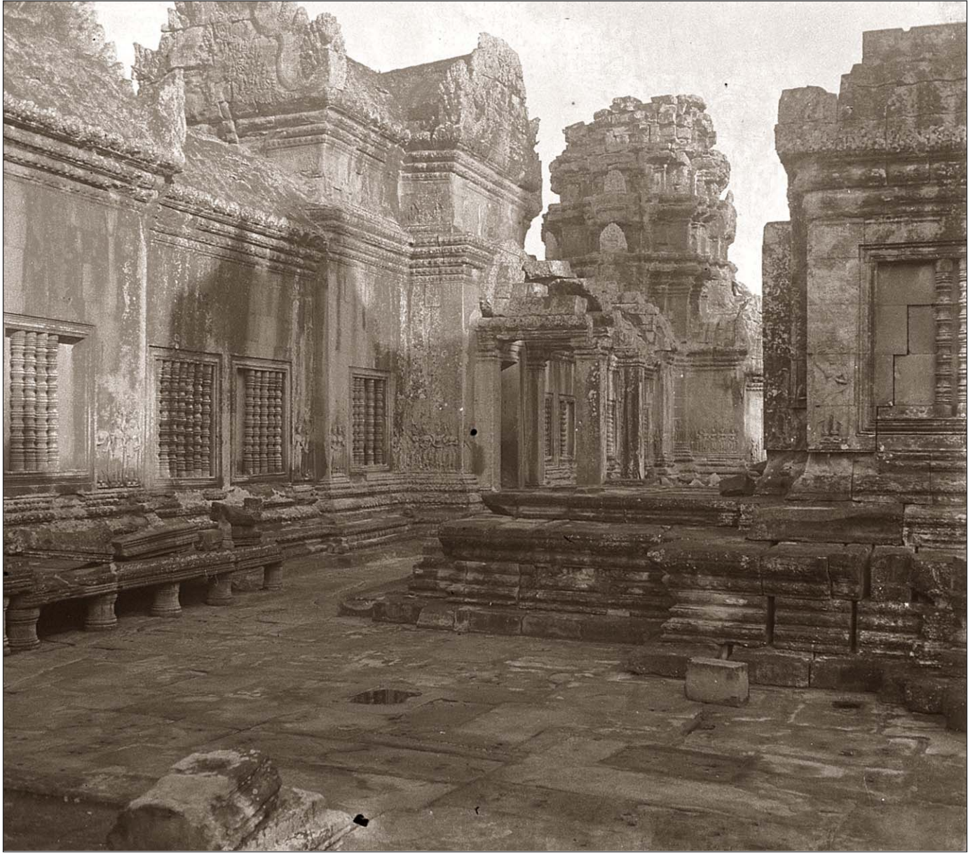
Ruines d'Angkor (Vat) - La belle galerie du premier étage.