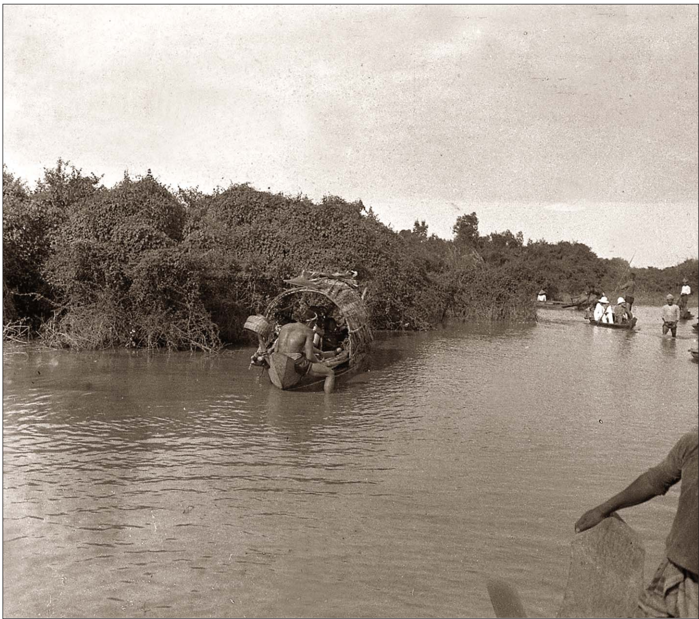
Sampans (pirogues enlisées).