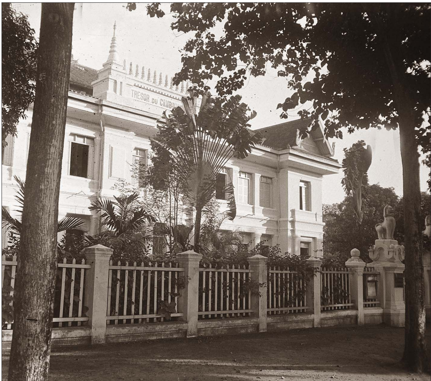
Arbre du voyageur à Phnom Penh.