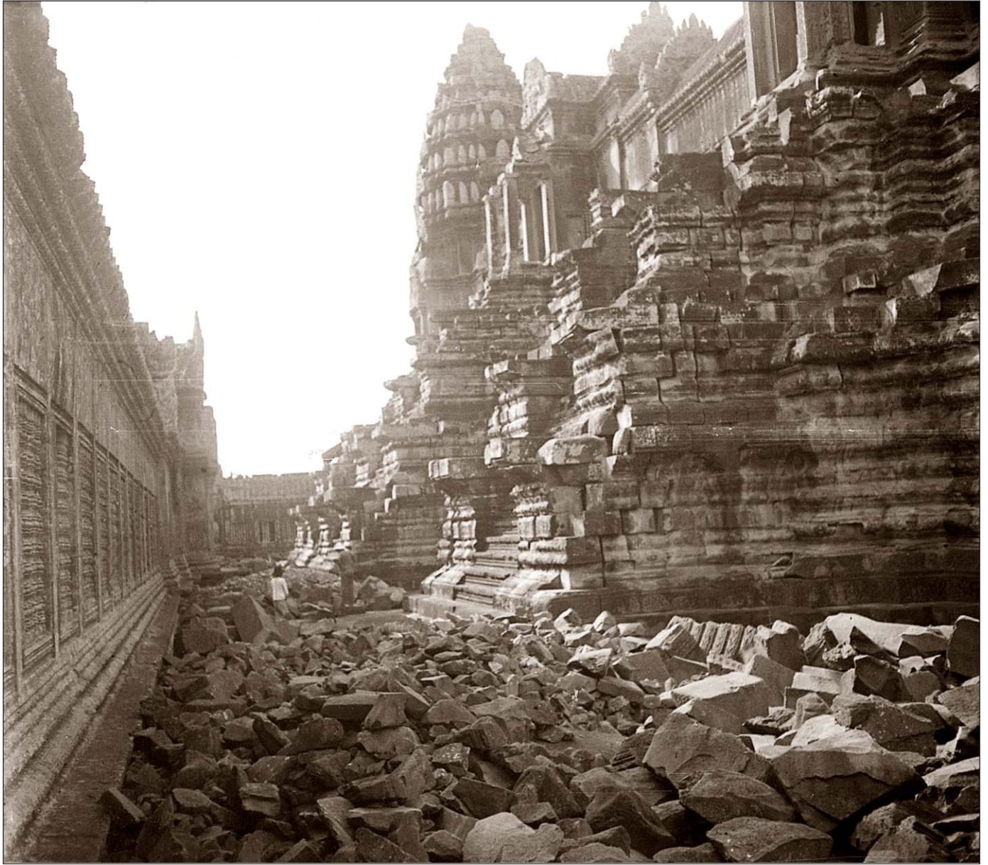
Angkor Vat - Cour du deuxième étage et massif du troisième étage.