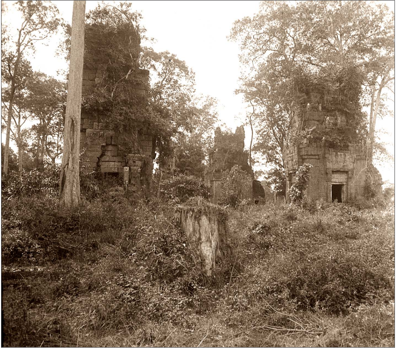
Angkor Thom - Deux tours.