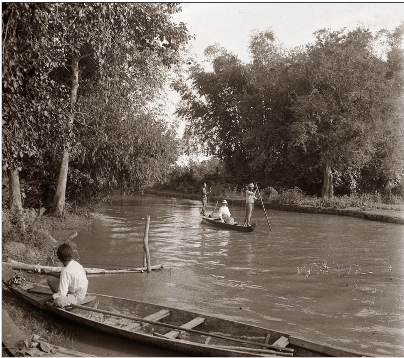
Le long de la rivière de Siem Reap - Nonie en pirogue.