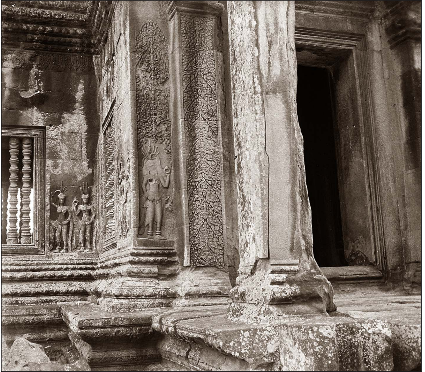
Angkor Vat - Tévasas et motif Renaissance.