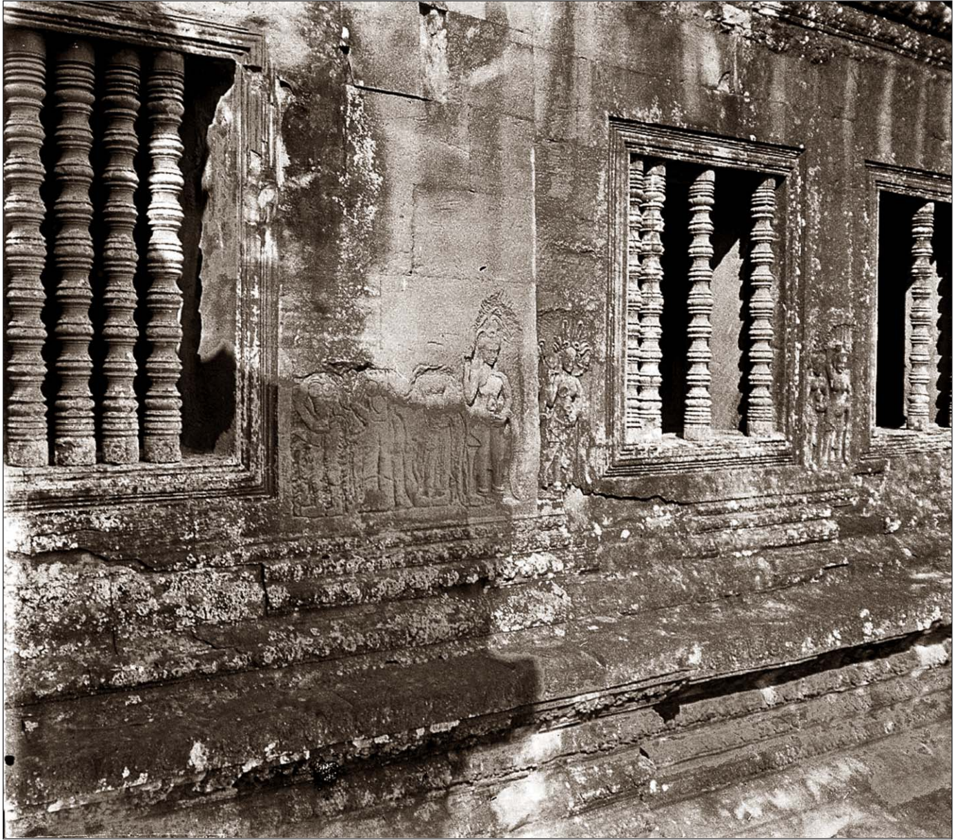
Angkor Vat - Les tévadas en partie achevées (troisième étage).