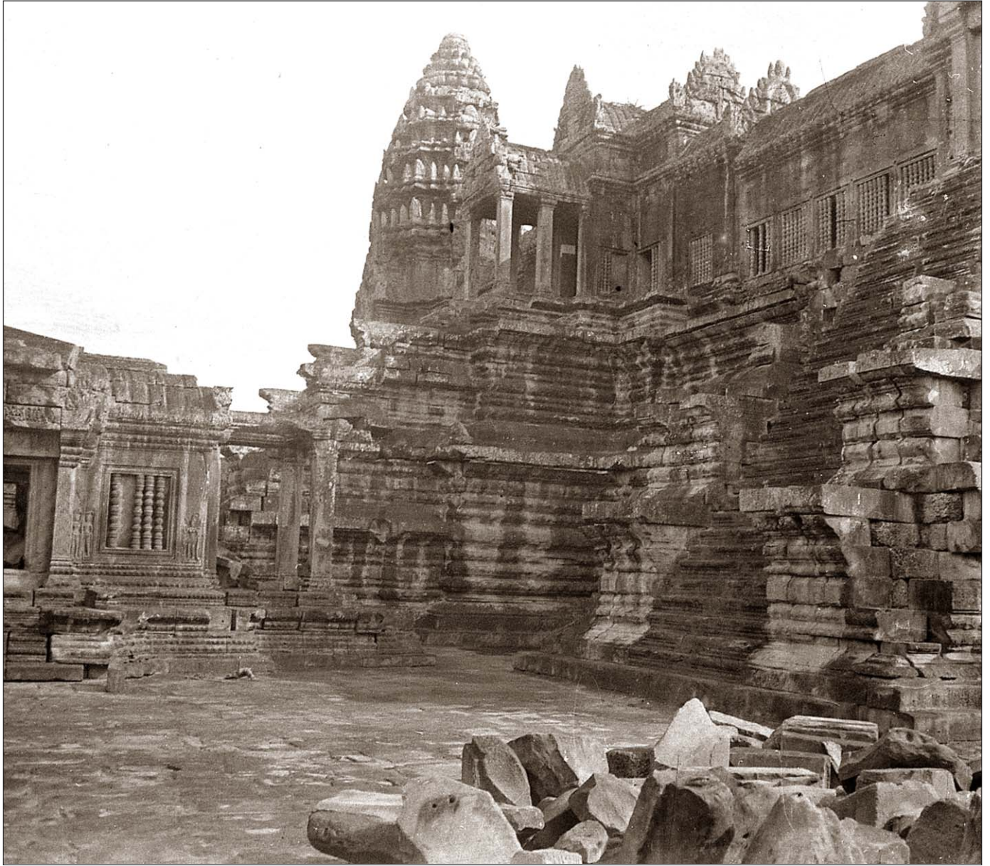
Angkor Vat - Cour des deuxième et troisième étages.