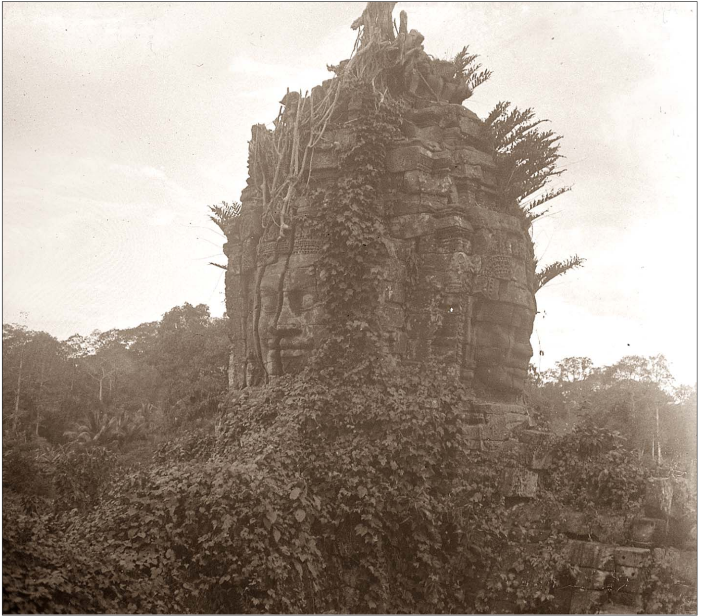
Angkor Thom - Le grand Bayon.