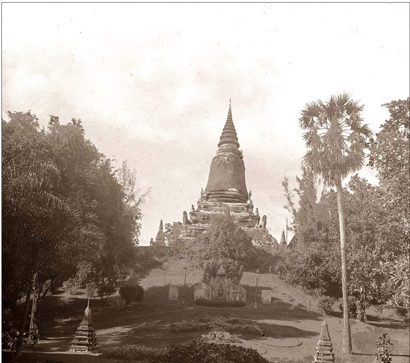
Phnom Penh - Le Wat Phnom, pagode bouddhiste.