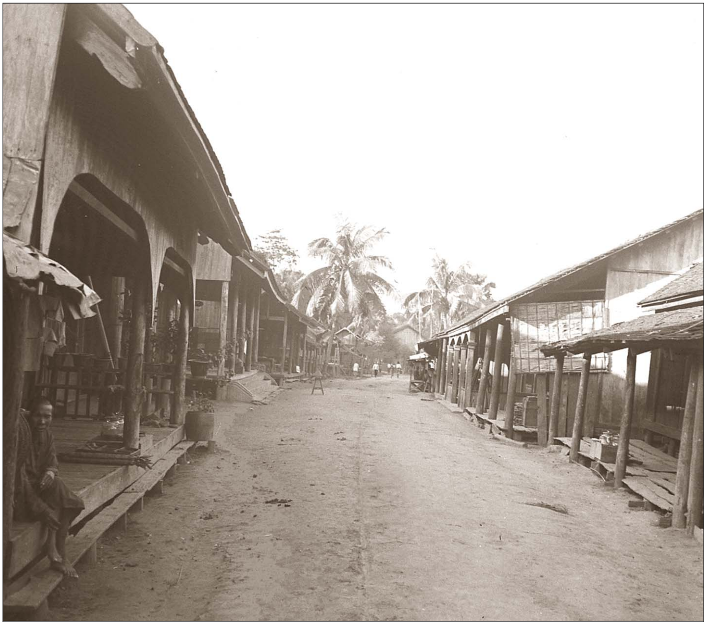
Siem Reap - Village.