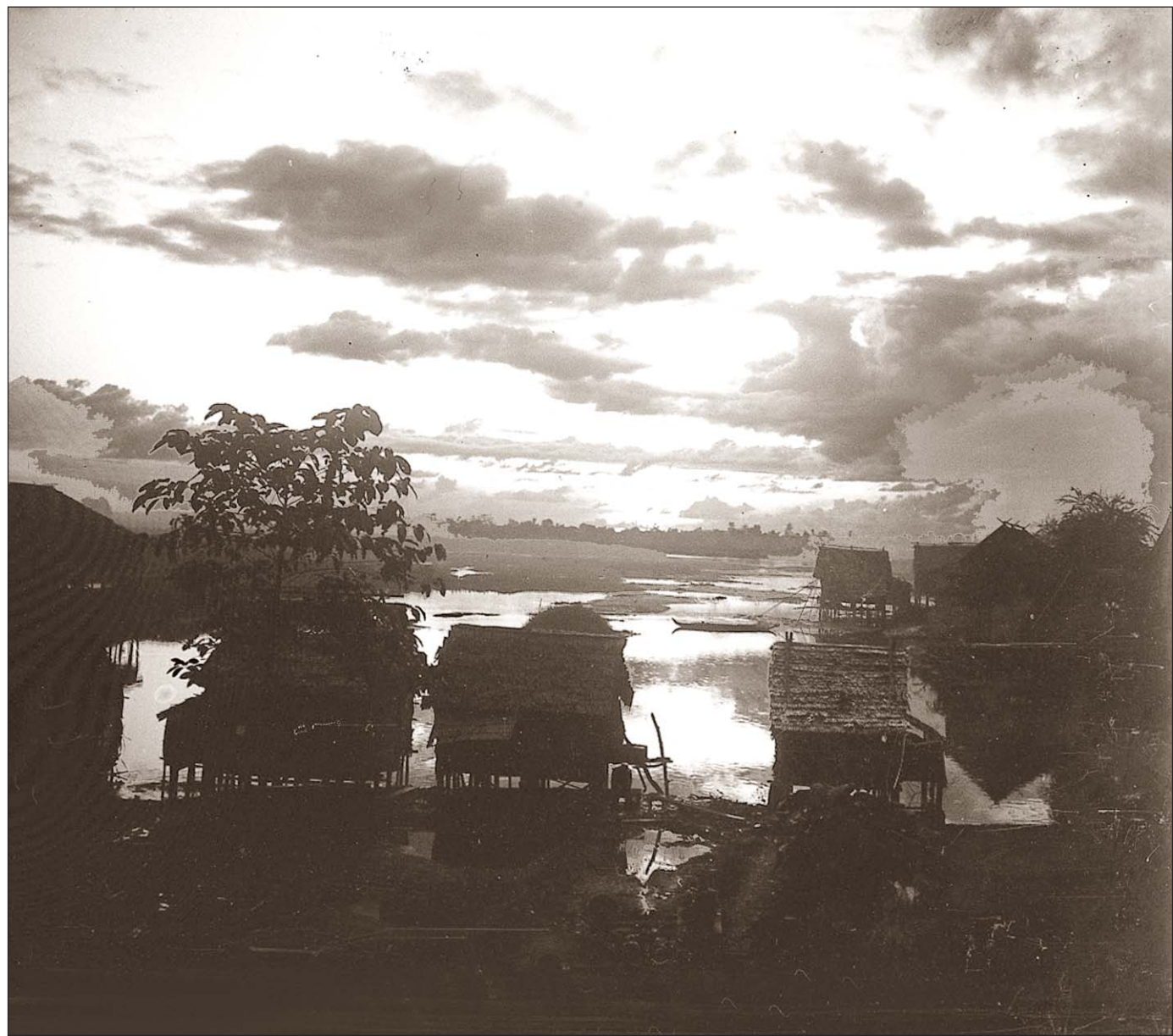
Phnom Penh - Coucher de soleil sur la lagune.