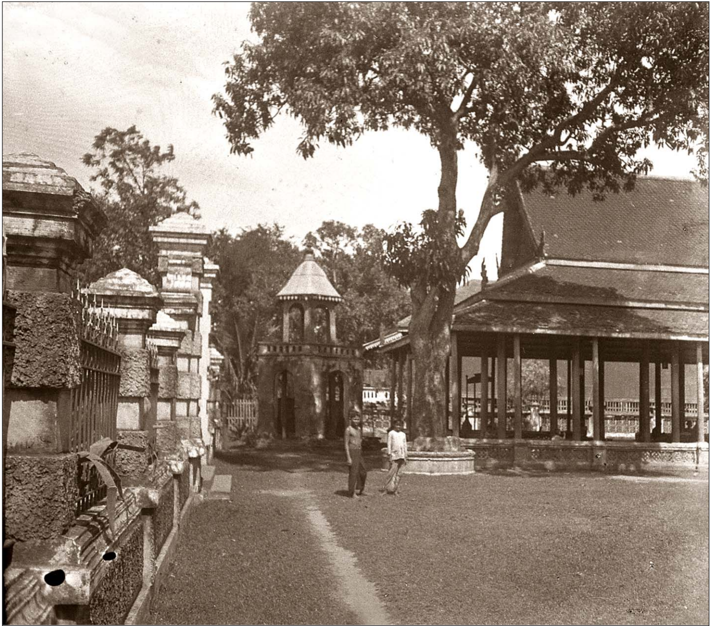
Phnom Penh - Une pagode.