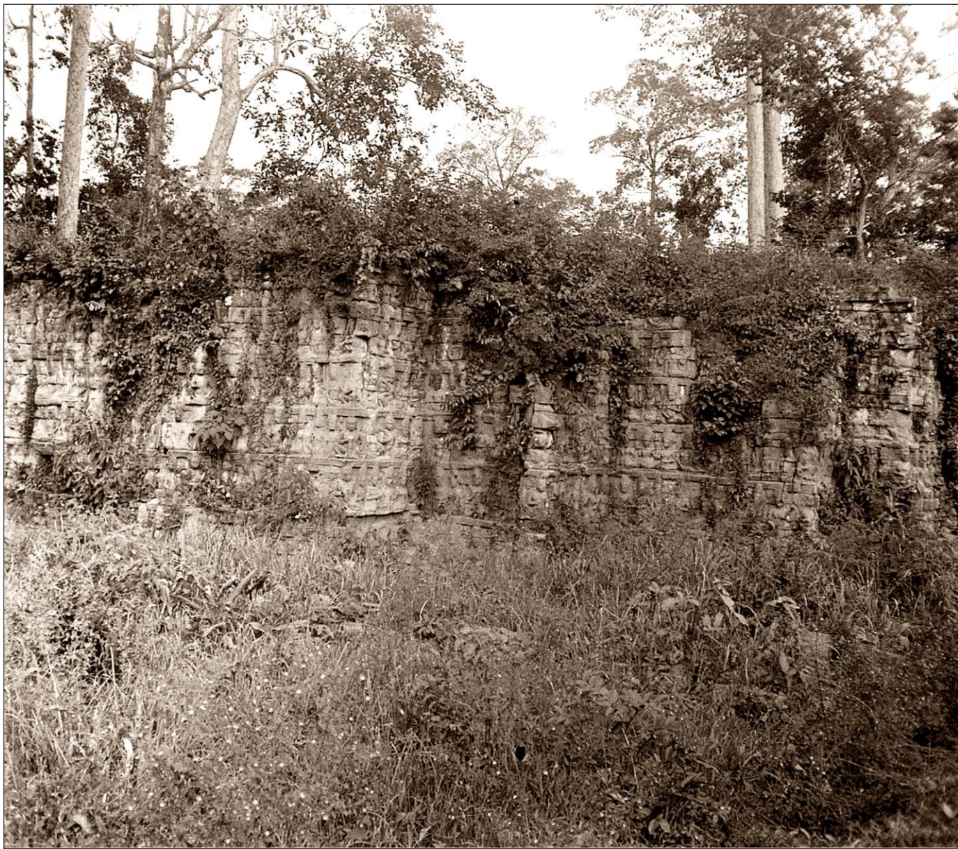
Angkor Thom - Terrasse du roi lépreux.