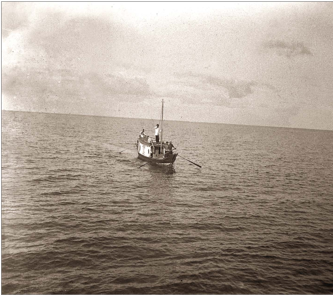
Sampan à Snoc Trou.