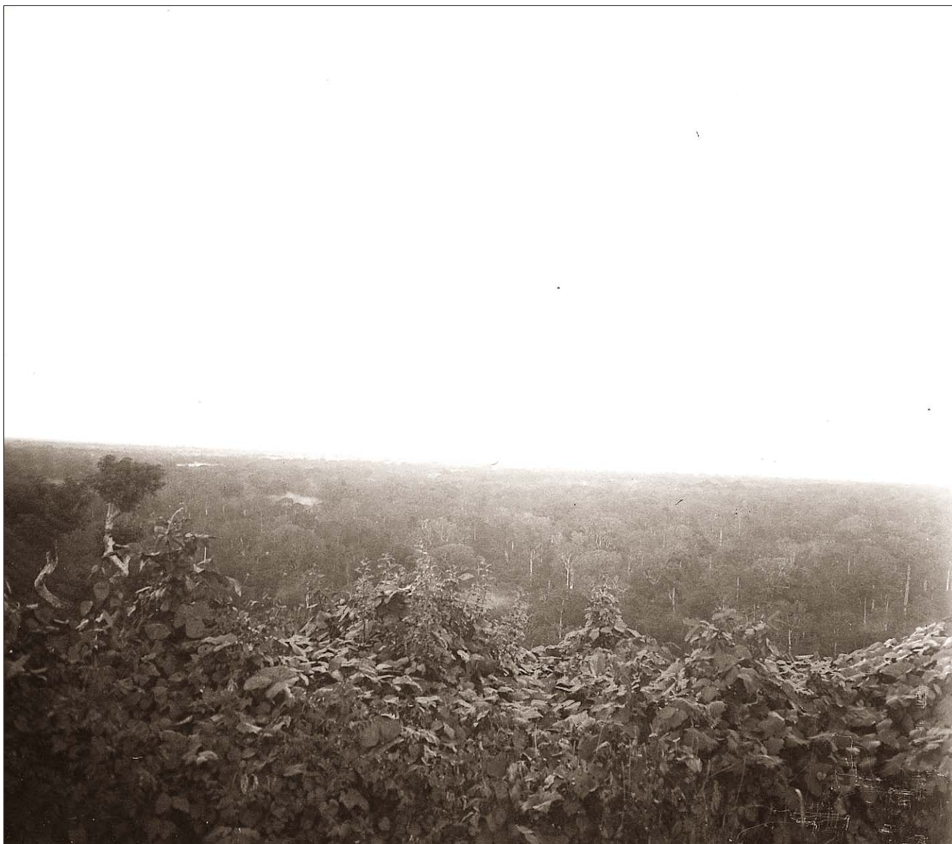
Preah Khan - Coucher de soleil.